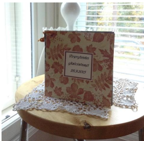
Kuva 5. Ryhmärunovihko

Erään ryhmäkokoontumisen alussa kuulin, kun ryhmän jäsen sanoi toiselle: ”Mitähän kivaa ne tänään on keksineet?” Virikeosuudet koostuivat muun muassa perinneleikistä, ryhmän jäsenen musiikkiesityksestä, voimaa antavan toivomusiikin kuuntelemisesta ja ryhmärunojen kirjoittamisesta. Ykstoistasista eli 11 sanan ryhmärunoista tein senioritalojen aulatiloihin pienet runokirjat, jotta asukkaat voisivat myöhemmin vielä lukea runojaan ja esitellä ryhmätuotostaan myös muille (kuva 5). Virikeosuuden houkuttelevuus ja hauskuus kannustivat osallistumaan, synnyttivät oivalluksia ja ideoita sekä auttoivat asukkaita löytämään uusia voimavaroja itsestään sekä asuinyhteisön muista jäsenistä.