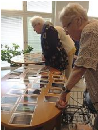
Kuva 6. Ovikortit

(Harju 2010, 14). Korttien avulla tavoittelimme tietoa siitä, millaisia ajatuksia senioritaloon muuttaminen oli asukkaissa herättänyt ja millaisia tulevaisuuden-toiveita heillä oli. Ensin asukkaat valitsivat ovikortin, jossa ovi oli suljettuna (kuva 6).