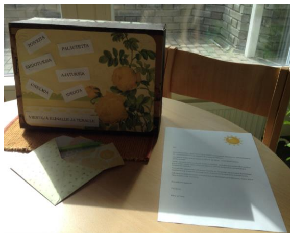
Kuva 4. Idea- ja palautelaatikko

Erään ryhmäkokoontumisen alussa kuulin, kun ryhmän jäsen sanoi toiselle: ”Mitähän kivaa ne tänään on keksineet?” Virikeosuudet koostuivat muun muassa perinneleikistä, ryhmän jäsenen musiikkiesityksestä, voimaa antavan toivomusiikin kuuntelemisesta ja ryhmärunojen kirjoittamisesta. Ykstoistasista eli 11 sanan ryhmärunoista tein senioritalojen aulatiloihin pienet runokirjat, jotta asukkaat voisivat myöhemmin vielä lukea runojaan ja esitellä ryhmätuotostaan myös muille (kuva 5). Virikeosuuden houkuttelevuus ja hauskuus kannustivat osallistumaan, synnyttivät oivalluksia ja ideoita sekä auttoivat asukkaita löytämään uusia voimavaroja itsestään sekä asuinyhteisön muista jäsenistä.