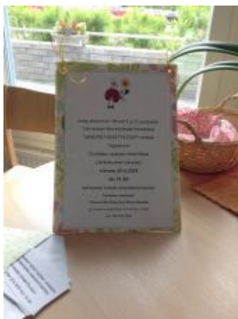
Kuva 3. Ryhmäkutsu ja muistilaput

Ryhmäkokoontumisesta toimitin kutsut senioritilojen yhteistilojen pöydille viimeistään viikkoa ennen kokoontumista. Muistin tueksi tein pieniä lappuja, joissa luki selkeästi ryhmän seuraavan kokoontumisen päivämäärä ja kellonaika. Mukaan otettavaksi tarkoitetut laput laitoin kutsun viereen. Kutsuista pyrin tekemään kauniita ja toimintaan mukaan houkuttelevia. Kiinnittämällä kutsujen esteettisyyteen erityistä huomiota osoitin samalla kunnioitusta ja arvostusta asukkaita kohtaan (kuva 3).