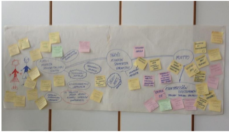
Kuva 7. Palvelupolku muuttotilanteesta

Seuraavaksi ryhmä valitsi joukostaan kaksi edustajaa, jotka seuraavana päivänä esittelisivät palvelupolkukuvauksen Iltatähden toiminnanjohtajalle ja senioritalon vastuuhenkilölle. Idea palvelukuvauksen esittelemisestä niille, jotka muuttotilanteesta ja sen eri toiminnoista Iltatähdessä vastaavat, tuli ryhmän jäseneltä. Keskustelu ja ideointi jatkuivat johdon ja asukkaiden tapaamisessa. Keskustelussa syntyneet uudet ideat kirjattiin ylös palvelupolkujulisteeseen.