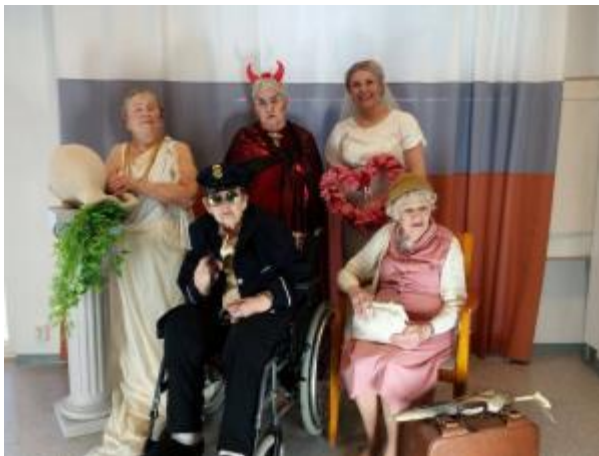
Kuva 2. Unelmaroolit

Viereisessä huoneessa artesaani-stylistiopiskelija toteuttaa Iltatähdessä asukkaiden unelmia ja haaveita meikkaamalla, pukemalla ja kuvaamalla heitä valitsemisissaan rooliasuissa (kuva 2).