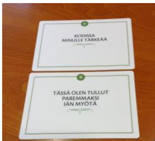
Kuva 9. Myönteisen muistelun kortteja

Kolmannella tapaamiskerralla jatkoimme toisiimme tutustumista. Valitsimme keskustelun virittäjäksi Myönteisen muistelun kortit , joiden avulla pyrittiin vahvistamaan hyvää oloa kertomalla mukavista muistoista, omista vahvuuksista sekä itselle merkityksellisistä asioista (kuva 9). Yhtä tärkeää oli niin kertomisen kuin kuuntelemisen kokemus. Myönteisen muistelun kortit ovat esimerkki Suomen Mielenterveysseuran Mielen hyvinvoinnin rakennuspuut ikääntyville -MIRAKLE 2012–2016 -hankkeessa tuotetusta välineestä. Ikääntyneiden kannalta hanke on erityisen merkittävä siksi, että kaikki kehitystyö tehdään yhteistyössä ikäihmisten kanssa. Myös Myönteisen muistelun kortit on palvelumuotoiltu yhteiskehittämisen menetelmiä käyttäen ikäihmisten kanssa. (Suomen Mielenterveysseura 2016a; Suomen Mielenterveysseura 2016b.)