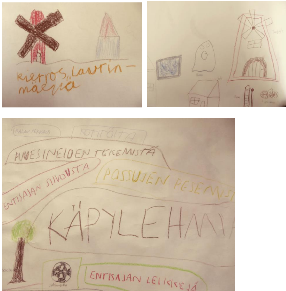
Kuva 1. 5.-6.-luokkalaisten suunnitelmia museoviikolle

Mielikuvamatkan jälkeen lapset jakaantuivat pienryhmiin omien toiveidensa mukaan ja etsivät luokasta ryhmälleen mukavan paikan työskennellä. Pyysimme lapsia ottamaan esiin haluamansa värit tai kynät ja jaoin heille suuret paperit tehtävää varten. Papereille sai piirtää ja kirjoittaa omien mieltymyksien mukaan. Aikaa suunnittelutyöhön oli varattu 30 minuuttia. Suunnittelu oli pienryhmien kesken hyvin erilaista, toisille vaivatonta ja toisille jopa hieman haastavaa. Ryhmien keskinäinen vuorovaikutus toimi, kuten olimme toivoneet ja pääasiallisesti ryhmäläiset tukivat toisiaan suunnitteluprosessissa. Eräässä ryhmässä tämä tosin johti siihen, että yhden oppilaan ryhtyessä piirtämään satuhahmoja ja örkkejä, muu ryhmä seurasi mallia ja lopuksi ryhmä itsekin totesi suunnittelun menneen vähän ”överiksi.” Huomasimme töiden edetessä, että tytöt olivat paljon kriittisempiä omalle tekemiselleen kuin pojat ja tämä vaikeutti huomattavasti yhden tyttöporukan yhteistä tekemistä. Seka- ja poikaryhmien työskentely vaikutti toimivan mutkattomammin ja paperit täyttyivät ideoista, kun omiin piirustustaitoihin ei suhtauduttu niin kriittisesti. Työskentelyn jälkeen jokainen pienryhmä esitteli työnsä muille ja iloksemme huomasimme, että oppilaat antoivat palautetta myös muille ryhmille tehdyistä töistä.