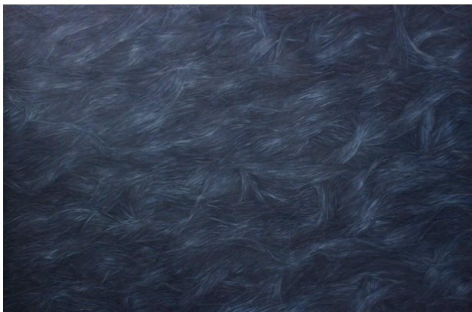
Kuva 2, Mediation, vesiliukoinen öljyväri kankaalle, 167 x 113 cm, 2015