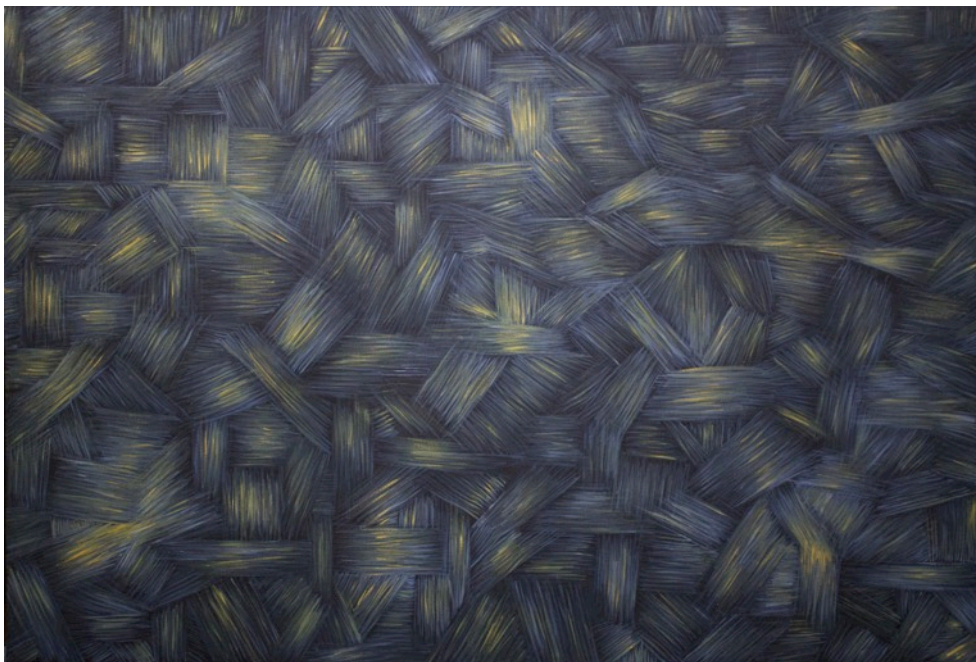
Kuva 3, Gray & Gold, vesiliukoinen öljyvärei kankaalle, 167 x 113 cm, 2015