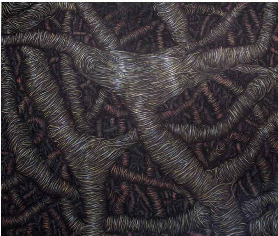
Kuva 7, Fever Dream, vesiliukoinen öljyvärei kankaalle, 200 x 170 cm, 2016

Lopputyöni on Fever Dream -niminen öljyväreimaalaus (Kuva 7). Teoksen maalasin vesiliukoisilla öljyväreillä cotton duck -kankaalle. Alkuperäinen suunnitelmani oli tehdä usean isokokoisin maalauksen sarja, mutta näyttelypaikan tilalliset rajoitteet osaltaan vaikuttivat siihen, että keskityin lopulta vain yhteen työhön. Teos on toistaiseksi suurikokoisin mitä olen maalannut. Aikaisemmissa töissä olen tutkinut eri sommitelmaratkaisuja ja kuvan rakennetta, kuinka täytän ison kuva-alan pienellä siveltimellä. Lopputyössäni halusin yhdistää oppimani asiat ja tekniikat. Suuren pohjan kanssa pääsin täysin nauttimaan itse maalausprosessista, maalaustelinettä ei tarvinnut, vaan maalaaminen hoitui seisaaltaan, liikkuen teoksen edessä.