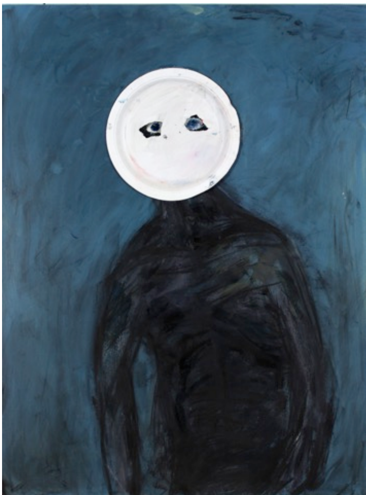
Kuva 6, Epäkunnossa, sekatekniikka MDF-levylle, 60 x 80 cm, 2013

Yllä oleva teos on kasvanut itselleni tärkeäksi (Kuva 6). Taiteen yksi hieno aspekti, on sen toimiminen emotionaalisenä aikakoneena, kyseinen teos toimii minulla muistutuksena huonommasta voinnista. Maalaus syntyi yhdistelmätekniikan kurssilla 2013. Teoksessa käytin akryy livärejä ja hiiltä. Likaisella siniharmaalla pohjalla on rujosti piirretty riutunut ja nääntynyt hahmo. Hahmo koostuu jostain hauraasta materiaalista, pysyen hädin tuskin kasassa, pienestä henkäyksestä se ehkä hajoaa tuhkana ilmaan. Hahmon kasvot peittää pahvilautanen, johon leikatut silmänreiät, joiden takaa kolmiulotteista massasta muovatut surumieliset, siniset silmät. Teos vie minut tuohon olotilaan. Ilmeetön ja kasvoton hahmo, varjo entisestä itsestään. Katsoen maailmaa paperilautasen takaa. Tunteeton, väritön, hajuton olemassaolo. Turhautumisen tunne, lukittuna omaan raskaaseen kehoon, pelko ja epävarmuus tulevasta. Teos on myös otanta myös sen hetkisestä luovasta tilasta, riisuttu ja raaka ilmaisu, pienimmällä mahdollisella vaivalla ja energian käytöllä toteutettu, huolimaton ja vähäeleinen jälki. Ajan saatossa ja työtilasta toiseen siirtelystä johtuen pahvinaamari on