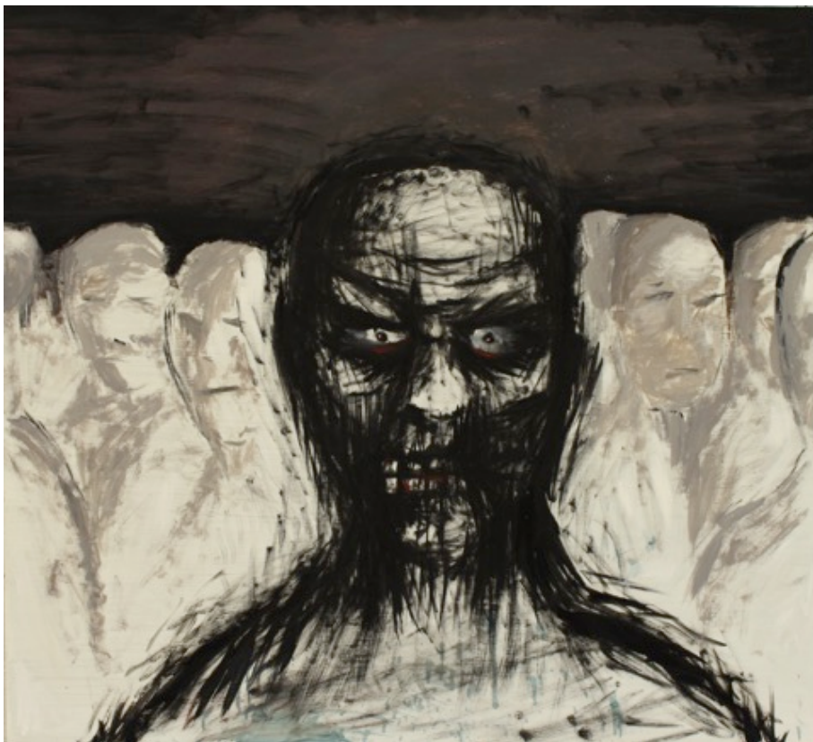
Kuva 4, Läpivalaistu raivo, öljyväri kovalevylle, 2012

Kuva-aiheet kumpusivat silloisesta sosiaalisesta ahdistuksesta ja yksinäisyydestä. Päämäärättömyydestä, tulevaisuus oli epävarmaa, olin yksin suurien elämänmuutosten edessä. Teoksista puskee vahvasti läpi nuoruuden angstia, ja yleistä hämmennystä. Taiteen rooli on ollut myös aggressioiden purkua, kuvan ja etenkin musiikin kanssa, molemmat ilmaisumuodot ovat aina kulkeneet käsi kädessä.