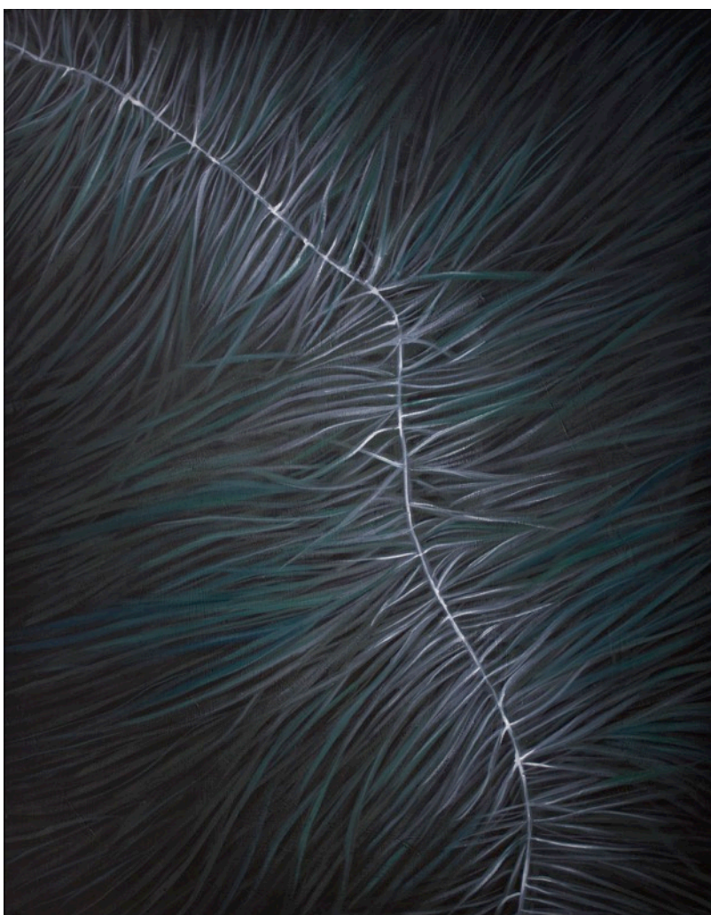
Kuva 4. Neural Pathways, vesiliukoinen öljyvärei mdf-levylle, 2015