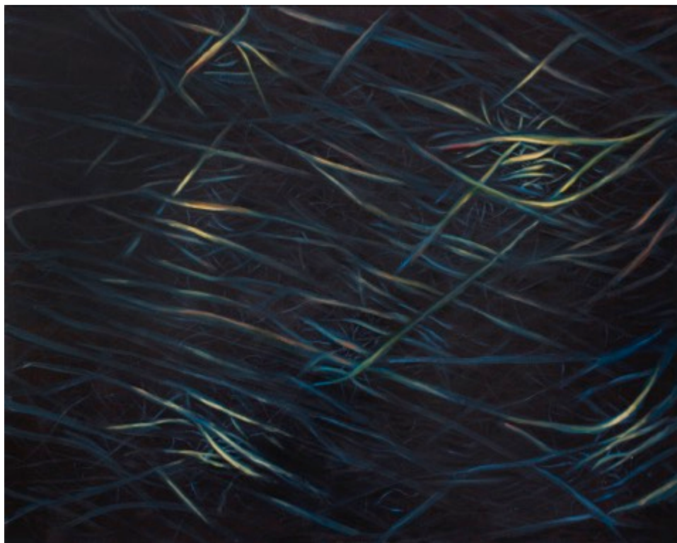
Kuva 1, Depths, akryyli kovalevyllä, 120 x 95 cm, 2014

Teosten kasvustot ja verkostot jatkuvat loputtomiin, niihin voi sukeltaa syvemmälle ja syvemmälle, pääsemättä lopulta minnekään. Voi vain antautua aaltoilevan liikkeen mukaan. Rakennan yhtenäisiä, hengittäviä organismeja, jotain orgaanisen ja epäorgaanisen väliltä, hengittävää terästä. Taustalla ajatus ikuisuudesta, vankina aineettomassa tilassa, limbossa. Sukellus lapsuuden kuumepainajaisiin.