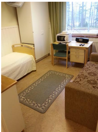
KUVA 1. Siivottu vierashuone

Siivoustyön laatu koostuu sekä teknisestä laadusta että toiminnallisesta laadusta. Diakonialaitoksen henkilöstöpäällikkö Pääkkönen oli tyytyväinen Ammattiopisto Luovin opiskelijoiden tekemään laatuun kaikin puolin. Työn laadusta pääasiallinen vastuu on Luovin henkilökunnalla, joka varmistaa, että sovitut asiat tulevat tehtyä sovitun mukaisesti eli laadukkaasti. Teknisen laadun takaamiseksi on laadittu ylläpitosiivousohjeet Ammattiopisto Luovin koti-työ- ja puhdistuspalvelujen koulutuksen henkilökunnan käyttöön. Liite 3 sisältää laaditut ylläpitosiivousohjeet. Ammattiopisto Luovin henkilökunta tekee kirjallisista ohjeista mm. kuvalliset ohjeet opiskelijoiden käyttöön, jotta oppiminen helpottuisi. Kuvat auttavat myös sovitun työn laadun saavuttamisessa. Esimerkiksi kuva vierashuoneesta auttaa opiskelijaa mielämään miltä siivotun vierashuoneen tulee näyttää ollakseen laadukkaasti tehty.