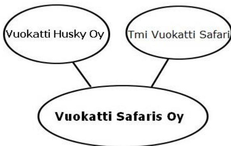
Kuva 1. Yritysfuusio.