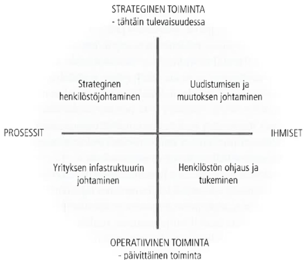
Kuva 2. Henkilöstöjohtamisen tehtävät kilpailukykyisen yrityksen kehittämisessä (Viitala 2009, 29).

Jotta yrityksen liiketoimintastrategiat voisivat toteutua, täytyy henkilöstöjohtamisen olla kunnossa. Sen merkitys on suuri, sillä vain toimivalla henkilöstöjohtamisella pystytään varmistamaan, että yrityksellä on tarpeeksi osaavaa henkilökuntaa. Kun henkilöstöjohtaminen on tehty oikein, henkilöstö on motivoitunut ja halukas sitoutumaan yritykseen ja sen kehittämiseen. Yrityksen pitäisi aina päätöksiä tehdessään muistaa henkilöstöjohtaminen. (Viitala 2009, 10.)