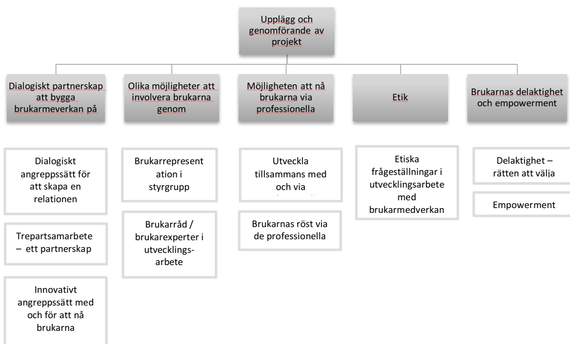
Figur 3. Upplägg och genomförande av framtida projekt för att stöda brukarmedverkan

Man vill komma till att utvecklingsarbetet inte är en belastning, utan att man ser att brukarna vill delta och har viktiga saker att säga. Där utvecklingsarbetet kan hjälpa och stöda även brukarens egen utvecklingsprocess.