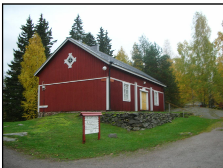
Kahvila Lilli ja Hugo

Kahvila Lilli ja Hugo toimii kartanon vanhassa talousrakennuksessa ja on kunnostettu 1950-luvun asuun. Kahvila on avoinna kesäkuukausina ja siellä on tarjolla emännän valmistamia leivonnaisia sekä päivittäin myös keittolounas. Kahvilassa on 60 paikkaa, joten se soveltuu hyvin myös juhlien pitoon. Matkailumaja sijaitsee kartanon vanhassa väentuvassa, joka on kunnostettu 1950-luvulla majoituskäyttöön. Kolme kahden hengen huonetta on palautettu 1950-luvun asuun. Majassa on yhteinen tupakeittiö ja tilauksesta lämmitetään myös kartanon vanha rantasauna.