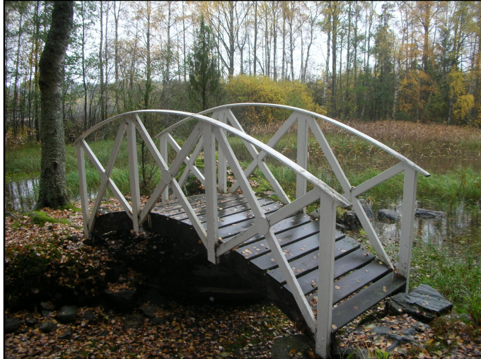
Silta Hugon saareen