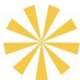
Kuva 6. Aurinko-objekti

Satakunnan sairaanhoitopiirin julkaisuun kuvitettua grafiikkaa tuli aika paljon, ne sitoivat julkaisua yhtenäisemmäksi ja toivat piristystä sivuille, joille ei ollut paljon kuvamateriaalia. Grafiikka (Kuvat 7 ja 8) oli yhtenäistä, ja kuvitukset liittyivät aina juttuun, jonka kanssa ne esiintyivät. Grafiikoissa toistui yhä uudestaan ja uudestaan aurinko-objekti (Kuva 6), jota käytin eri tavoin läpi julkaisun. Aurinko-objekti oli julkaisuun hyvä valita, sillä sitä pystyi varioimaan niin helposti ja se viittasi Kaste-ohjelmaan, joka toimi toimijana molemmissa hankkeissa.