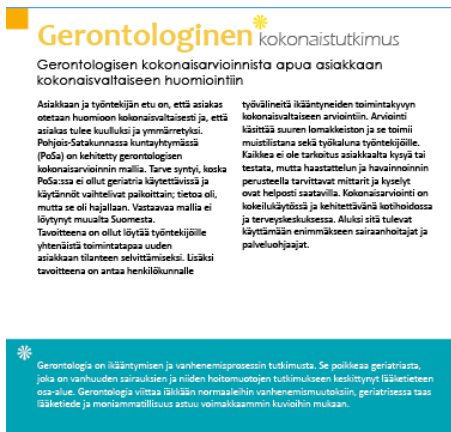
Kuva 11. Sana selitetään laatikossa

Tekstiä oikoluettiin muutamaan kertaan useamman tahon toimesta. Tekstissä piti ottaa huomioon, että julkaisun tulisi olla mahdollisimman selkosuomenkielinen ja sairaalasanastoa tulisi välttää. Joissain tilanteissa sairaalasanastoa ei kuitenkaan pystytty karsimaan artikkelista pois, joten parhaaksi ratkaisuksi nähtiin sanan avaaminen sivun alareunassa olevassa infolaatikossa (Kuva 11).