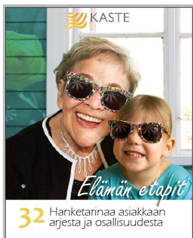
Kuva 9. Etukansi

Aurinko-objekti esiintyy ensimmäisen kerran jo kansikuvassa, kun se on heijastuksena pienen tytön ja tämän isomummun aurinkolaseissa (Kuva 9).