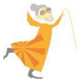
Kuva 7. Iloinen mummo