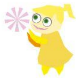
Kuva 8. Tyttö ja pallo

Aurinko-objekti esiintyy ensimmäisen kerran jo kansikuvassa, kun se on heijastuksena pienen tytön ja tämän isomummun aurinkolaseissa (Kuva 9).