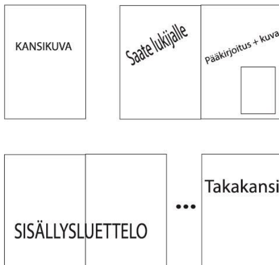
Kuva 1. Julkaisun kuvakäsikirjoitus

Suunnitelmavaiheessa on hyvä myös miettiä, millaisella tyylillä julkaisu toteutetaan. On olemassa vakiintuneita termejä, jotka kuvaavat sommittelun tyyliä ja miten teksti ja kuva niillä sijoittuvat. Satakunnan sairaanhoitopiirin julkaisu taitettiin dynaamisella taitolla, jossa kuvat ja teksti ovat epäsymmetrisesti ja eikä niillä ole tiettyä vakiintunutta paikkaa sivulla. (www.graafinen.com.)