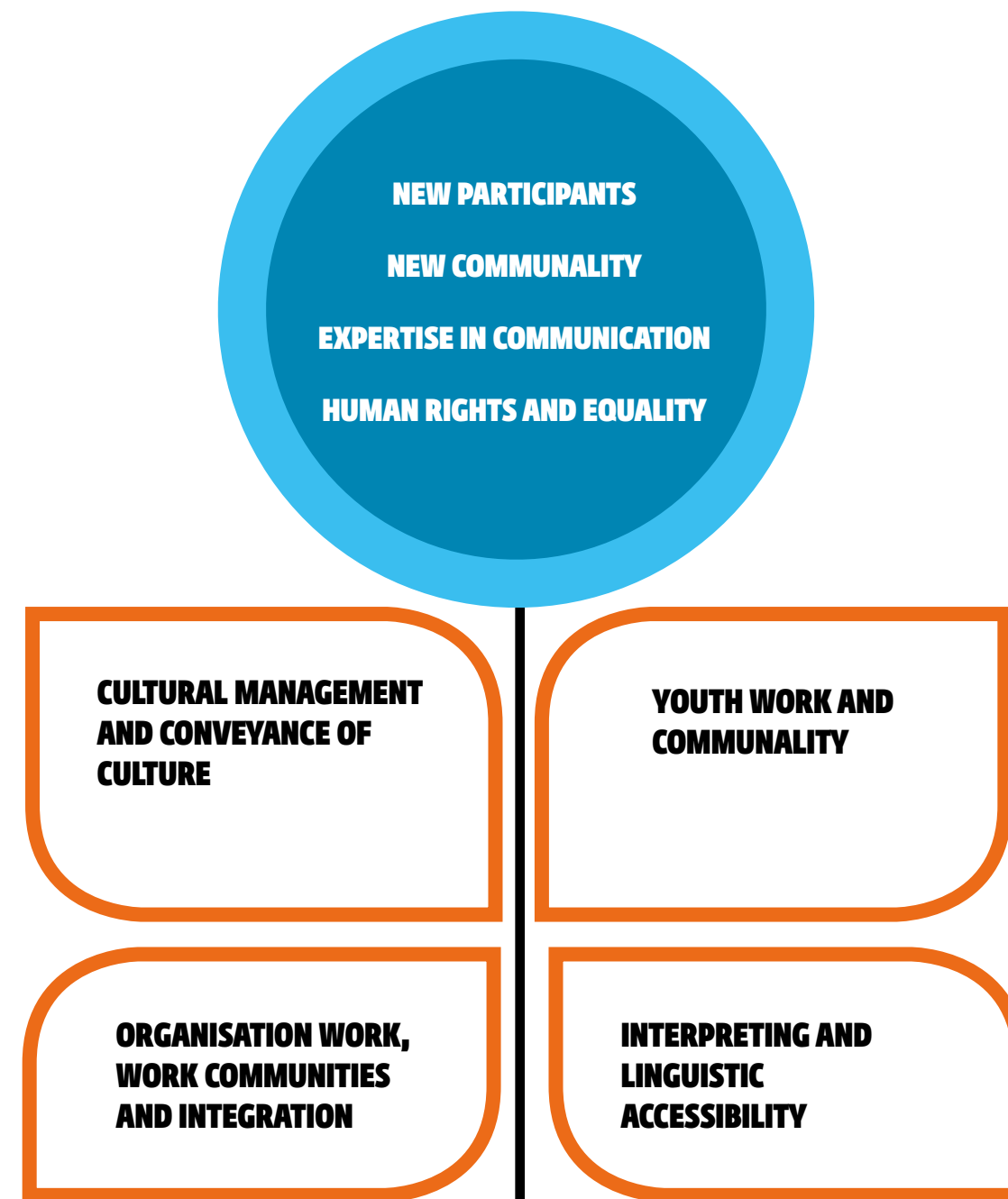
Conceptual drawing. Humak’s strengths and new, emerging fields

We believe in our own ability to leave a mark in society and to develop the university, in accordance with our strategic objectives.