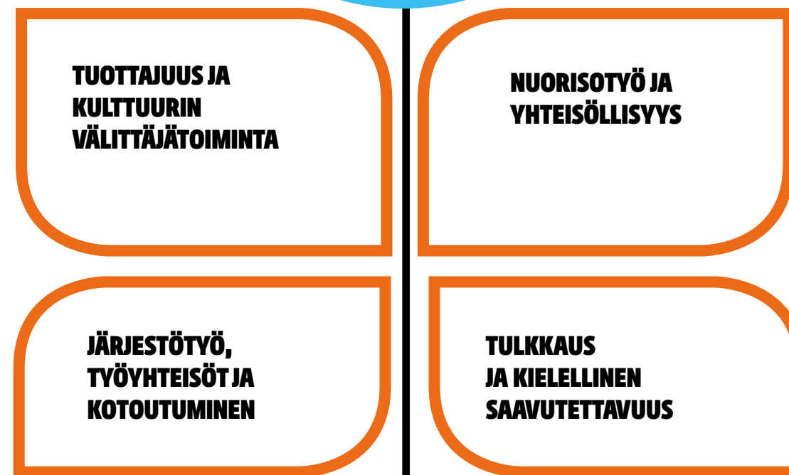
Havainnekuva. Humakin vahvuusalat ja uudet nousevat alat