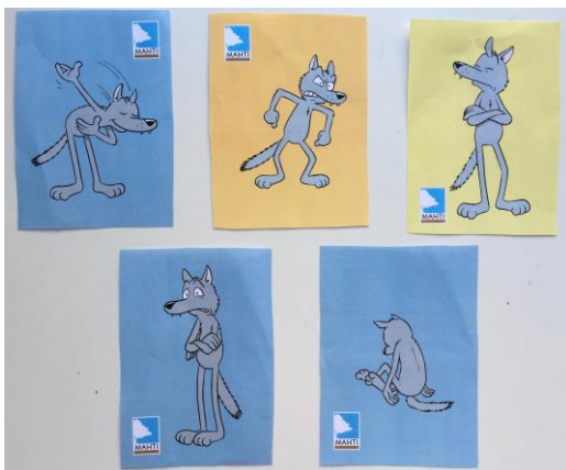
Kuvio 5. Bettyn tunteita kuvaavat MAHTI-tunnekortit (MAHTI-projekti 2012–2015, Kehitysvammaisten Tukiliitto).

Tilanteen tulkinnassa pohdittiin Bettyn ja Kennyn ajatuksia kohtauksen aikana. Nuorten mukaan Betty oli kohtauksessa turhautunut veljeensä ja hän alkoi epäilemään hänen syyttömyyttä. Nuoret olivat molemmat sitä mieltä, että Kenny koki tilanteensa toivottomaksi, eikä hän pystynyt luottamaan kehenkään. Henkilöhahmojen tunteita pohdittiin MAHTI-tunnekorttien avulla. Pyysin nuoria ensin valitsemaan kortin, joka kuvaa henkilö-hahmon ulkoista käyttäytymistä, ja toisen joka kuvaa hahmon sisäisiä tunteita. Nuori 1. alkoi rakentamaan MAHTI-tunnekorteista ketjua (kuvio 5.), joka kuvaa Bettyn käyttäytymistä ja tunteita kohtauksen aikana. Nuori 2. osallistui tunnekorttien valintaan. En keskeyttänyt nuorten tekemistä, vaan annoin heidän tehdä kuvion loppuun ja kehuin nuoria heidän kekseliäisyydestään. Ensimmäinen kortti kuvasi Bettyn olemusta ennen ristiriidan kärjistymistä. Nuorten mielestä Betty vaikutti tyytyväiseltä, kun hän oli löytänyt keinon, joka voi todistaa Kennyn syyttömyyden. Toinen kortti esittää Bettyn vihastumista Kennylle, kun Kenny kertoo ettei aio tehdä DNA-testiä. Nuoren 2. mukaan kortti kuvaa hyvin Bettyn kehonkieltä ristiriitatilanteessa. Kolmas kortti kuvaa Bettyn loukkaantumista Kennylle, jonka jälkeen Betty lähti tilanteesta pois. Neljäs kortti kuvaa Bettyn pelkoa siitä, että Kenny onkin syyllinen. Viides kortti kuvaa Bettyn pettymystä siihen, että hänen ponnistelut Kennyn vapauttamiseksi menevät hukkaan, eikä veli pääse ikinä pois vankilasta.