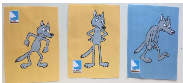
Kuvio 2. Nuorten valitsemat MAHTI-tunnekortit Stevelle (MAHTI-projekti 2012–2015, Kehitysvammaisten Tukiliitto).

SIP-mallin toisessa vaiheessa eli tilanteen tulkinnassa pohdimme henkilöhaamojen ajatuksia ja tunteita ristiriitakohtauksen aikana. Ryhmässä pohdittiin miksi Steve kävi käsiksi Peteen. Nuoret kokivat että henkilöhaamoilla oli vaikeuksia itsehillinnässä. Nuori 2. arveli myös Peten ärsyttäneen tahallisesti sanavalinnoillaan Steveä. Henkilöhaamojen tunteita pohdittiin MAHTI-tunnekorttien avulla. Pyysin nuoria valitsemaan yhden tai useamman kortin, jotka kuvaavat heidän mielestä parhaiten Steven ja Peten tunteita kohtauksessa. Kaikki nuoret kuvailivat Steven tunnetta vihaksi ja heidän mielestä tunnetta kuvaava kortti oli helppo löytää. Vaikka kaikki nuoret kuvailivat Steven tunnetta vihaksi oli mielenkiintoista huomata, että jokainen nuori valitsi eri kortin kuvaamaan kyseistä tunnetta.