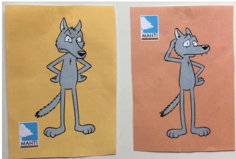
Kuvio 8. Nuoren valitsemat MAHTI-tunnekortit Peterille (MAHTI-projekti 2012–2015, Kehitysvammaisten Tukiliitto).

Seuraavaksi pyysin nuorta valitsemaan MAHTI-tunnekortit, jotka kuvaavat parhaiten henkilöhahmojen ulkoapäin havaittavia tunteita ja sisäisiä tunteita. Nuori valitsi kortit nopeasti. Hänen mielestä Peterin ulkoapäin näkyvä tunteesta tuli esiin viha Sydneyä kohtaan, koska kohtauksessa Peter syytti häntä mainoskuvista ja parisuhdeongelmistaan. Nuori arveli Peterin tuntevan ehkä sisimmissään olonsa toivottomaksi ja pelokkaaksi, koska niin moni asia hänen elämässään oli mennyt pieleen lyhyellä aikavälillä. Sydneyn ulkoista olemusta nuori kuvasi yllättyneeksi, koska hän ei olettanut Peterin suuttuvan mainoskuvista. Nuoren mukaan Sydney saattoi kuitenkin tuntea olonsa surulliseksi, koska hän halusi vain auttaa kaveriaan, eikä aiheuttaa hänelle lisää harmia.