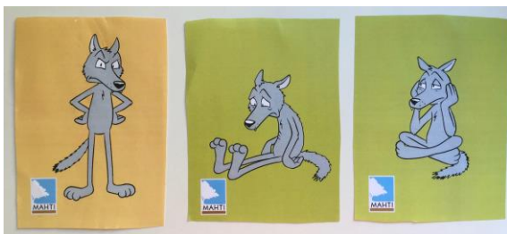
Kuvio 6. Kennyn tunteita kuvaavat MAHTI-tunnekortit (MAHTI-projekti 2012–2015, Kehitysvammaisten Tukiliitto).

olonsa turhautuneeksi, sillä vaikka hän tekisi DNA-testin, voidaan häntä silti syyttää vielä jostain toisesta asiasta. Nuori 2. koki Kennyn välinpitämätön, koska tilanne näytti hänestä niin toivottomalta. Nuoren mielestä Kenny saattoi tuntea itsensä myös masentuneeksi. Nuoret yhdistivät Bettyn käyttäytymiseen monia eri tunteita, kun taas Kennyn käyttäytymiseen vähemmän. Nuorten mielestä Bettyn tunteita oli helpompi pohtia, koska hän toi ilmeiden ja puhetyylin kautta erilaisia tunteita esiin. Kenny oli heidän mielestä kohtauksessa vetäytyneenä, eikä hänen tunteensa vaihdelleet niin paljon kuin Bettyn.