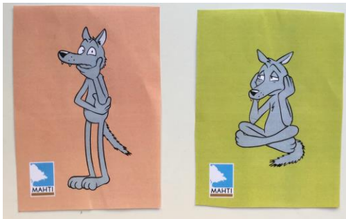
Kuvio 9. Nuoren valitsemat MAHTI-tunnekortit Sydneylle (MAHTI-projekti 2012–2015, Kehitysvammaisten Tukiliitto).