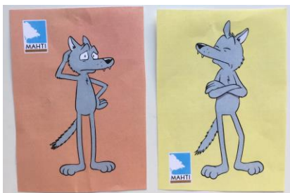
Kuvio 3. Nuorten valitsema MAHTI-tunnekortit Petelle (MAHTI-projekti 2012–2015, Kehitysvammaisten Tukiliitto).

Peten tunnetta kuvaavaa korttia nuoret etsivät pidempään. Nuoren 1. mukaan Pete oli tilanteessa hämmentynyt, koska hän ei olettanut Steven olevan vihainen hänelle. Nuori 2. taas arveli Peten tunteneensa olonsa loukatuksi, koska Pete ei omasta mielestään tehnyt mitään väärää. Nuori 3. ei osannut sanoa, mikä kortti kuvaa hänen mielestä Peten tunnetta. Ehdotin nuorelle että hän voi myös kuvailla suullisesti Peten tunnetta, jos tunnekortin valinta tuntuu haastavalta. Nuori kertoi että hän ei osaa sanoa mitä Pete kohtauksen aikana tuntee. Nuori vaikutti tehtävästä ahdistuneelta, joten jatkoimme SIP-mallin seuraavaan vaiheeseen.