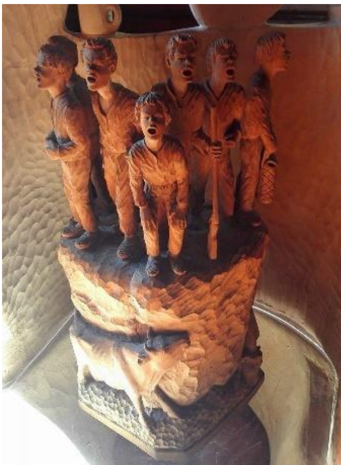
Kuva 1. Eva Rynänen "Veljekset Hiidenkivellä"

puuhun veistetty Veljekset Hiidenkivellä (kuva 1). Työ herätti huomiota valtakunnallisesti, ja hänestä tehtiin lehtiartikkeli Suomen Kuvalehteen. (Laininen 1992, 6.)