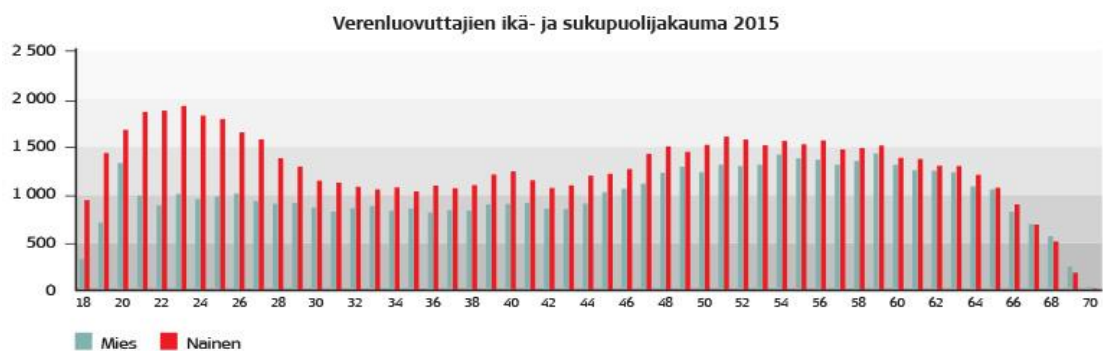
Kuvio 1. Verenluovuttajien ikäjakauma (Veripalvelun vuosi 2015).

Kuten verenluovuttajien ikäjakaumasta (katso alta kuvio 1) voidaan huomata, on suuri osa luovuttajista ikääntymässä ja poistumassa luovuttamisen piiristä. Tämän vuoksi uusia nuoria luovuttajia kaivataan sitoutumaan säännölliseen verenluovutukseen. On myös huomattavissa, että nuorten miesten verenluovutus keskittyy 20 ikävuoteen, jonka jälkeen heidän osuutensa luovuttajista laskee radikaalisti.