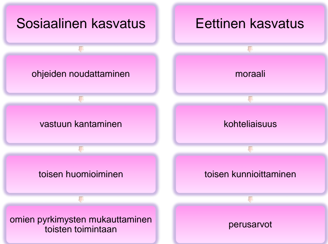
TAULUKKO 2. Sosiaalinen- ja eettinen kasvatus

senäisesti toteutettavaan liikuntaan, jonka avulla perheen sisäinen yhteenkuuluvuus ja vuorovaikutus kohenevat. Liikunnan kautta on mahdollista harjoitella sosiaaliseen- ja eettiseen kasvatukseen liittyviä sisältöjä. (Arvonen 2004, 35–36; Telama 2000, 60.) Sosiaalisen- ja eettisen kasvatuksen taulukosta (TAULUKKO 2.) näemme osan niiden perusteista.