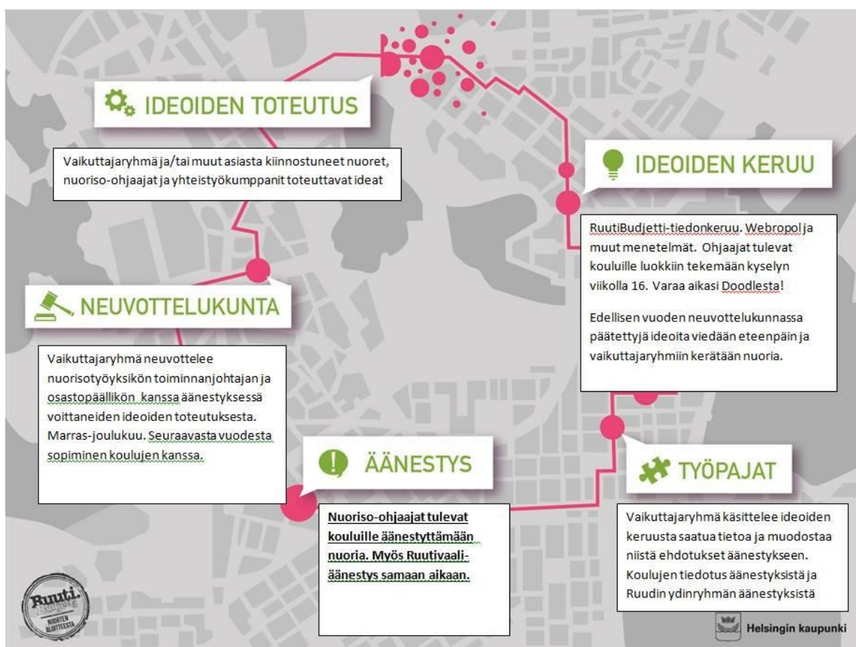
Kuva 2. RuutiBudjetin perusmallin vuoden kierto.

Neuvottelutoimikunta koostuu prosessiin mukaan lähteneistä nuorista, eniten ääniä saaneiden ehdotusten mahdollisista yhteistyökumppaneista, sekä budjetista vastaavasta esimiehestä. Neuvottelutoimikunta käy läpi eniten ääniä saaneet ehdotukset ja pohtii jatkotoimenpiteitä ja asian edistämistä, jos idea on reilusti yli budjetin. (Gräno, 2015,59–60.) Hyvänä esimerkkinä omasta aineistostani on kaupunginosan kehittäminen, jossa toiveena oli muuttaa hiekkapohjaiset jalkapallokentät tekonurmiksi. Tarkennan vielä, että aineistoni on tiedonkeruu vaiheesta, eikä kyseistä ehdotuksesta ole vielä äänestetty.