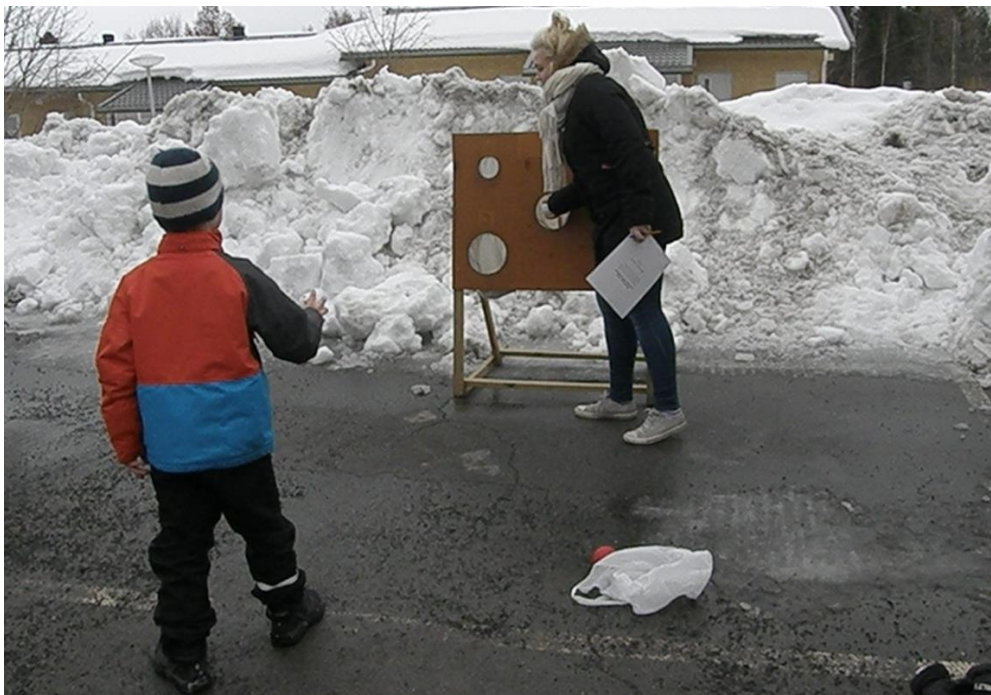
KUVA 6. Pallon tarkkuusheitto.

Uukuniemen Urheilijoiden toteuttama pallon tarkkuusheitto -toimintapiste sijaitsi seurakuntatalon parkkipaikalla noin viidenkymmenen metrin päässä itse rakennuksesta. Toimintapisteellä heitettiin palloja telineessä oleviin aukkoihin. Jokaisesta reikään osuneesta heitosta sai pisteitä. Vastuuhenkilöt kirjasivat tulokset ylös. Eniten pisteitä saaneet lapsi ja aikuinen palkittiin.