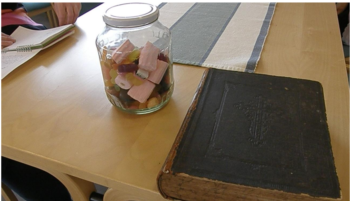
KUVA 3. Karkkipurkki ja vanha kirkkoraamattu.

Salissa sijaitsi myös Raamatun painon ja karkkien määrän arviointi -toimintapisteet. Tehtävänä oli arvioida vanhan suuren kirkkoraamatun paino mahdollisimman tarkasti Raamattua nostamalla. Toisessa arviointitehtävässä sai arvata lasipurkissa olevien karkkien kappalemäärän. Molemmissa tehtävissä jokaisella osallistujalla oli yksi arvaus, jonka toimintapisteen vastaava kirjoitti ylös. Raamatun painon lähimmäksi arvioinut osallistuja palkittiin yllätyspalkinnolla. Osallistuja, joka arvasi karkkien määrän lähimmäksi oikeaa, sai palkinnoksi purkin ja karkit.