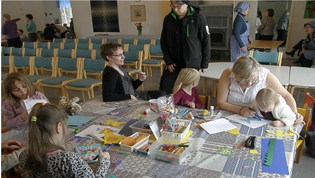
KUVA 2. Askartelupisteellä syntyi taideteoksia.

Salissa sijaitsi myös Raamatun painon ja karkkien määrän arviointi -toimintapisteet. Tehtävänä oli arvioida vanhan suuren kirkkoraamatun paino mahdollisimman tarkasti Raamattua nostamalla. Toisessa arviointitehtävässä sai arvata lasipurkissa olevien karkkien kappalemäärän. Molemmissa tehtävissä jokaisella osallistujalla oli yksi arvaus, jonka toimintapisteen vastaava kirjoitti ylös. Raamatun painon lähimmäksi arvioinut osallistuja palkittiin yllätyspalkinnolla. Osallistuja, joka arvasi karkkien määrän lähimmäksi oikeaa, sai palkinnoksi purkin ja karkit.