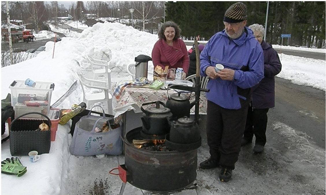
KUVA 7. Nokipannukahvi maistui hyvälle.

Vapaaehtoinen seurakuntalainen halusi tuoda tapahtumaan kuljetettavan nokipannukalustonsa ja tarjoilla tapahtuman osallistujille nuotiolla keitettyä nokipannukahvia. Nokipannukahvipiste oli sijoitettu seurakuntatalon edustalle. Kahvin juonnin lisäksi nuotio äärellä saattoi istuskella ja keskustella muiden tapahtumaan osallistuvien kanssa. Paikalle oli varattu myös välineitä pienten kisailujen järjestämiseksi, mutta tapahtuman tiimelyksessä vastuhenkilö unohti ottaa ne esille, joten kilpailut jäivät toteuttamatta.