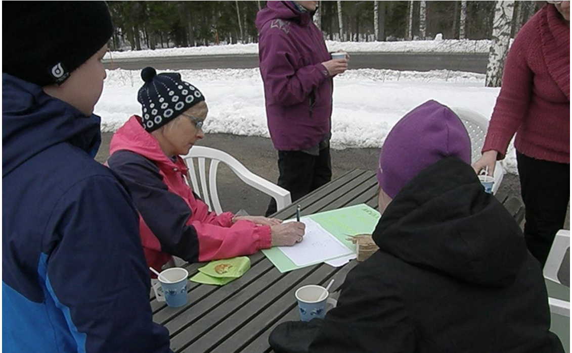
KUVA 6. Pöydän ääressä pohdittiin yhdessä männyn pituutta.

Uukuniemen Urheilijoiden toteuttama pallon tarkkuusheitto -toimintapiste sijaitsi seurakuntatalon parkkipaikalla noin viidenkymmenen metrin päässä itse rakennuksesta. Toimintapisteellä heitettiin palloja telineessä oleviin aukkoihin. Jokaisesta reikään osuneesta heitosta sai pisteitä. Vastuuhenkilöt kirjasivat tulokset ylös. Eniten pisteitä saaneet lapsi ja aikuinen palkittiin.