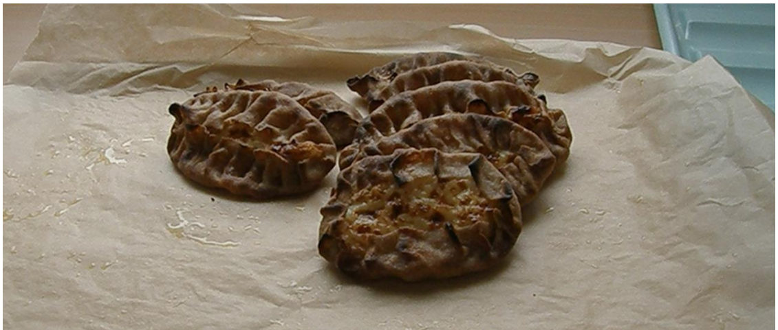
KUVA 1. Yksilöllisiä karjalanpiirakoita.

Yhdessä Uukuniemellä -tapahtumassa oli toimintapisteitä sekä sisätiloissa että ulkona. Martat opettivat keittiössä karjalanpiirakoiden leipomista . Seurakuntatalon salissa oli askartelupiste , jossa seurakunnan lapsityöntekijät ohjasivat pääsiäisaiheisia askarteluja. Askartelussa toimi apuohjaajana kaksi nuorta, uukuniemeläistä tyttöä. Näin mahdollistettiin se, että myös nuoret saivat olla jakamassa osaamistaan eri sukupolville. Askartelupiste oli järjestetty kahden eri korkeudella olevan pöydän äärelle, joten sekä lasten että aikuisten oli helppo osallistua.