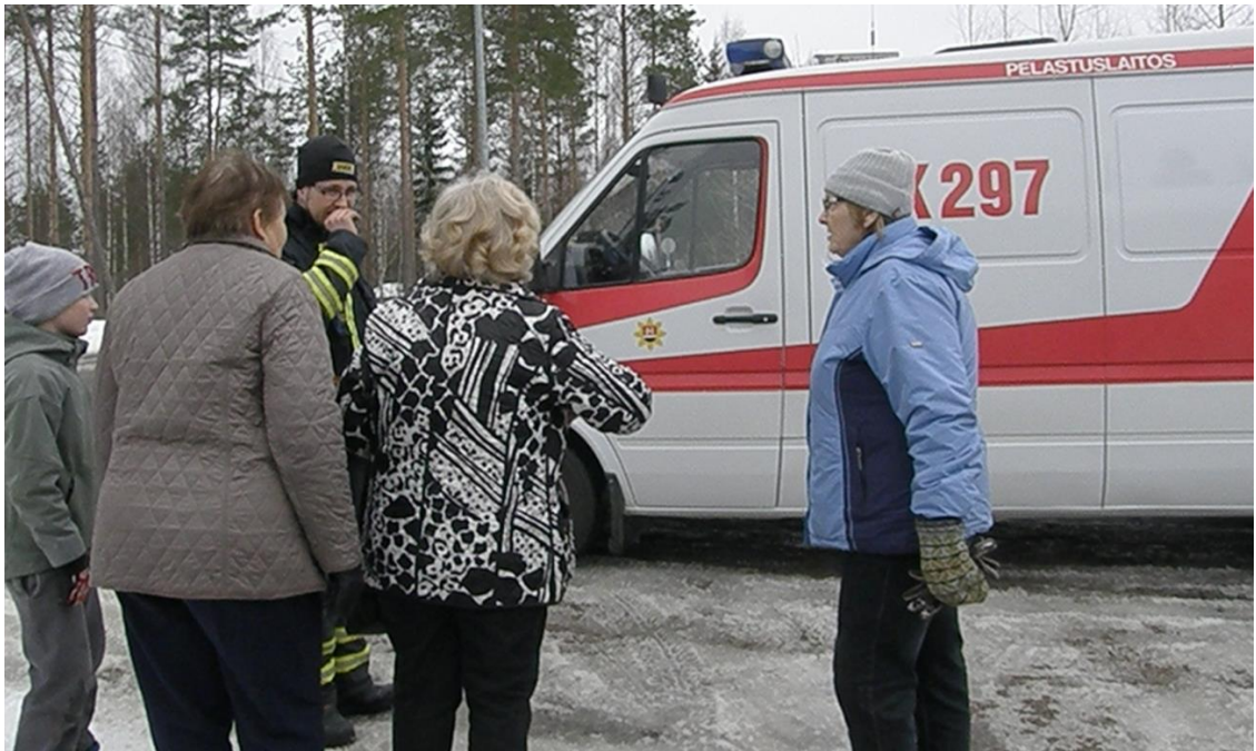
KUVA 5. Uukuniemen VPK:n toimintapiste kiinnosti eri-ikäisiä osallistujia.

Ulkona seurakuntatalon edustalla Uukuniemen Vapaaehtoisen Palokunnan jäsenten johdolla oli mahdollista harjoitella rasvapalon sammutusta sammutuspeitteellä sekä tutustua paloautoon . Myös Uukuniemen Maamiesseuran männyn pituuden arviointi -toimintapiste oli sijoitettu rakennuksen välittömään läheisyyteen. Toimintapisteellä tehtävänä oli arvioida rakennuksen edessä kasvavan männyn pituus mahdollisimman tarkkaan. Osallistuja merkitsi oman arvionsa toimintapisteellä olleeseen tehtäväpaperiin. Maamiesseuran vastuuhenkilö oli käynyt aiemmin mittaamassa koneellisesti puun pituuden. Lähimmäksi oikein arvannut henkilö palkittiin yllätyspalkinnolla.