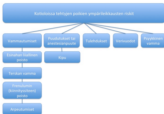
Kuvio 2: Kotiloissa tehtyjen ympärileikkausten riskit (Maïche 2013, 4).

Lääkäriliiton kannassa ei huomioitu sitä, että ympärileikkauksessa on kyse lääketieteellisestä toimenpiteestä ja yli miljardi ihmistä pitää toimenpidettä merkittävänä uskonnollisena rituaalina. Tämän vuoksi päätös oli tehty vain kustannussyistä, koska ympärileikkauksia tehdään joka tapauksessa vaikka sairaalat eivät niitä suostuisi tekemään. Tämä johtaa vaarallisiin komplikaatoriskeihin ja koviin kipuihin, kun toimenpide tehdään kotona, koska kaikilla vanhemmilla ei ole varaa yksityisen sairaalan maksuihin. 165