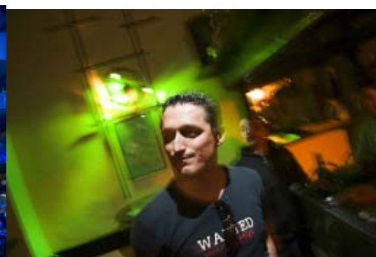
”wanted: smart, sexy, rich and single” Banana Bar, Mostar, 2005

Miesten välinen lojaalisuus ja veljeys pyritään rauhoittamaan minimoimalla kilpailua. Yksi keino on eristää naiset pois miesten toimintaympäristöstä. Länsimaissa tämän voi nähdä miesten itsensä rakentamissa pienoismaailmoissa, kuten klubeissa ja kerhoissa (ja