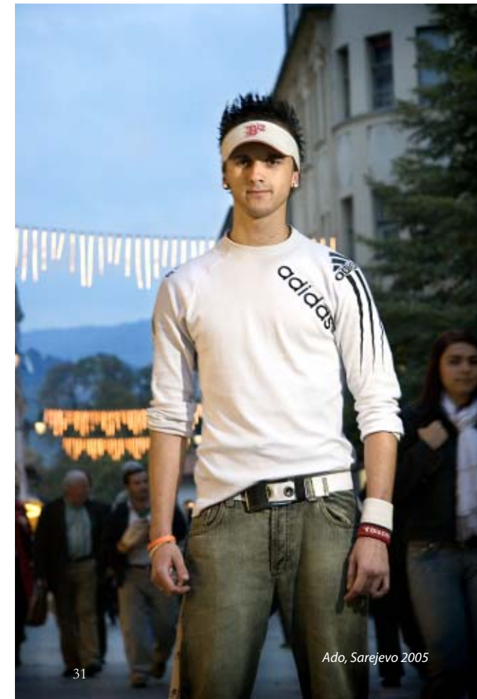
Ado, Sarajevo 2005

Toinen tapa valita kohteemme oli ulkoiset tekijät. Jos joku esimerkiksi pukeutui hyvin erottuvasti, pyysimme häntä malliksemme. Eräällä nuorella miehellä oli hyvin huoliteltu pukeutuminen, MTV:n malliin. Valkea toppaliivi, juuri tarpeeksi löysät farkut, valkoinen hikinauha päässä ja ranteessa, "timantit" korvissa sekä uskomaton vahatukka. Hän suostui heti pyyntöömme ja otti erilaisia asentoja mallin elkein. Emme kuitenkaan usko, että kyseessä oli ammattimalli. Hän oli vain omaksunut tyylin olla esillä ja vei sen täysillä loppuun asti, ilmentäen median "luomaa" identiteetin mallia. (Katso kappaleet 2.3 Median vallasta ja 2.4 subjektista ja identiteetistä).