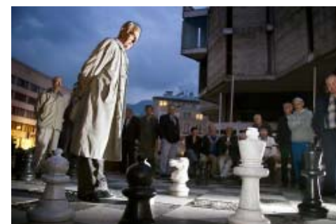
Ylh. Biljardisali, Durrës 2005 Shakkipeli, Sarajevo 2005

päivällä pikkulaudoilla shakkiruudukkoa ympäröivillä penkeillä. Illalla peli keskittyi suurelle laudalle. Halusimme kuvata peliä myös hämärtyvässä Sarajevon illassa. Tunteen olivat pinnassa tässäkin pelissä ja ikä ja tyyneys näytti olevan eduksi.