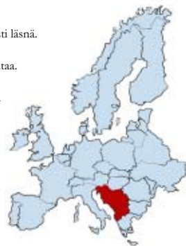
2.9 Kartat entisen Jugoslavian maista ja paikoista, joissa kuvasimme

Seuraavaksi kerromme itse työprosessin kulusta, metodeista, tuntemuksistamme ja ajatuksistamme sekä valokuvaamisen että muiden tilanteiden kautta. Lisäksi kokemukset ovat konkreettisia esimerkkejä käsittelemillemme asioille, kuten heteroseksuaaliselle hegemonialle, väkivallan kulttuurille tai katseen vallalle.