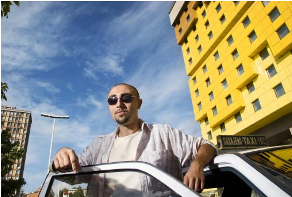
Zgembo ja Mercedes Benz 124, Hotel Holiday Inn, Sarajevo 2005