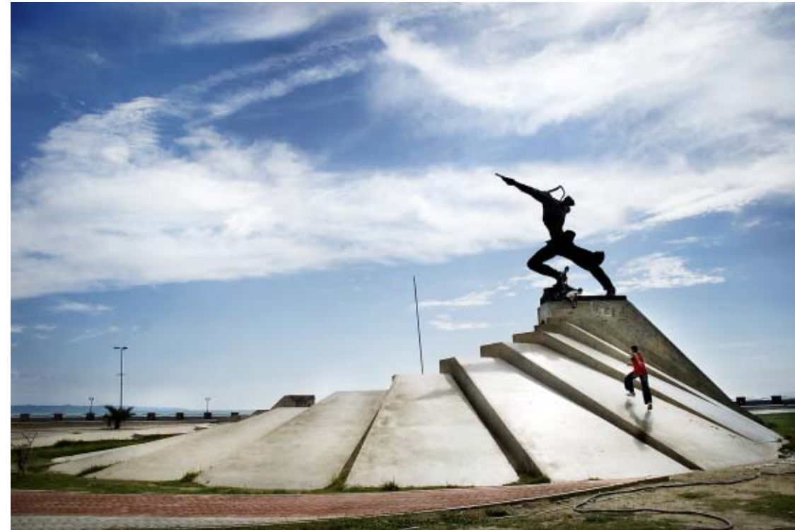
Albania, Durrës 2005

Hikoillen, ahdistuneena ja hysteerisenä poistumme asemalta ja päätämme mennä lähimpään baariin rauhoittavalle oluelle. Ylittäessämme tietä, kuuluu takaa varovainen tööttäys. Poliisipaku, josta kuuluu vaimeana kiimaisen poliisimiehen huuto: ”Vvouu-u-ou...”