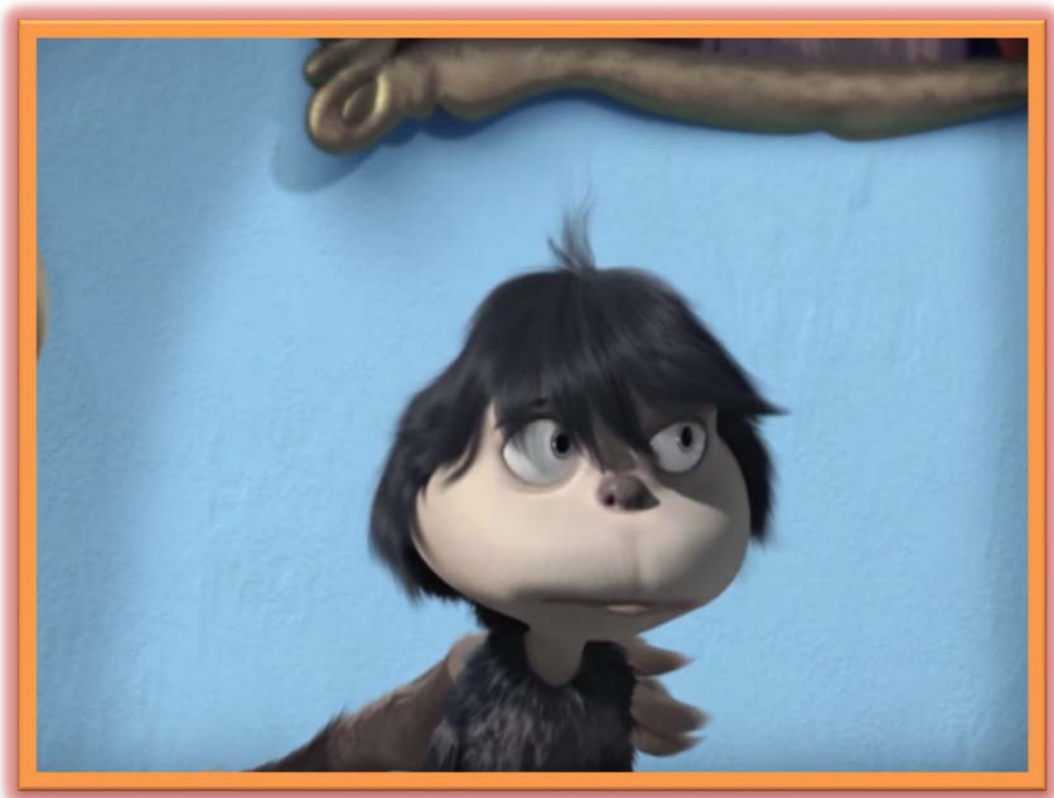
Kuva 3. Jojo, hahmo johon samaistuttiin. Kuvakaappaus elokuvasta Horton (2008).

olen hyvä” – puuhun. Puu rakennettiin siten, että yhteiseen runkoon kukin ryhmäläinen sai askarrella omanlaisensa oksan, johon kiinnitettiin lehtiä, jotka kuvasivat omia vahvuuksia. Tarvittaessa ryhmäläinen sai ohjaajan tukea vahvuuksien keksimiseen. Jatkossa puu nostettiin esille muilla ryhmäkerroilla. Yhteinen lopetus järjestettiin syömisen yhteydessä.