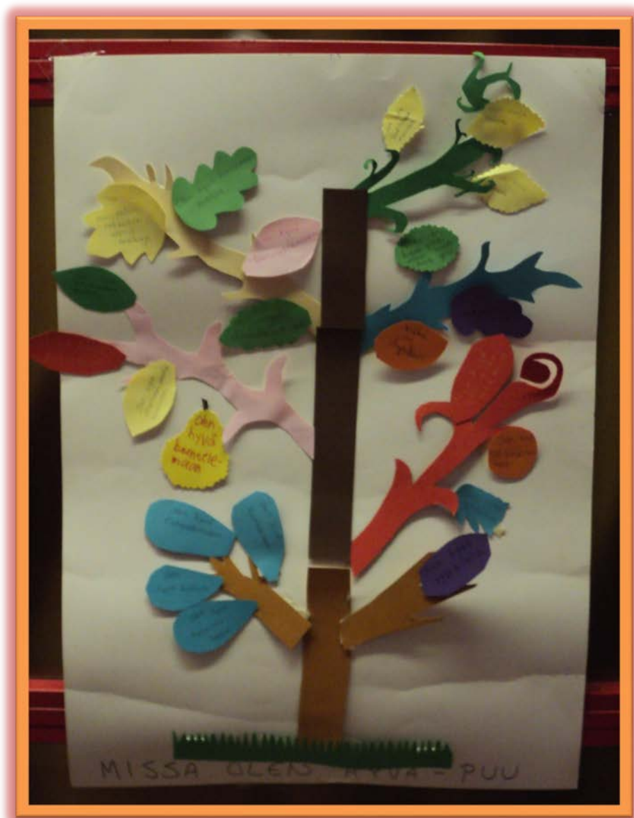
Kuva 2. Toisella ryhmäkerralla rakennettu "missä olen hyvä" -puu.