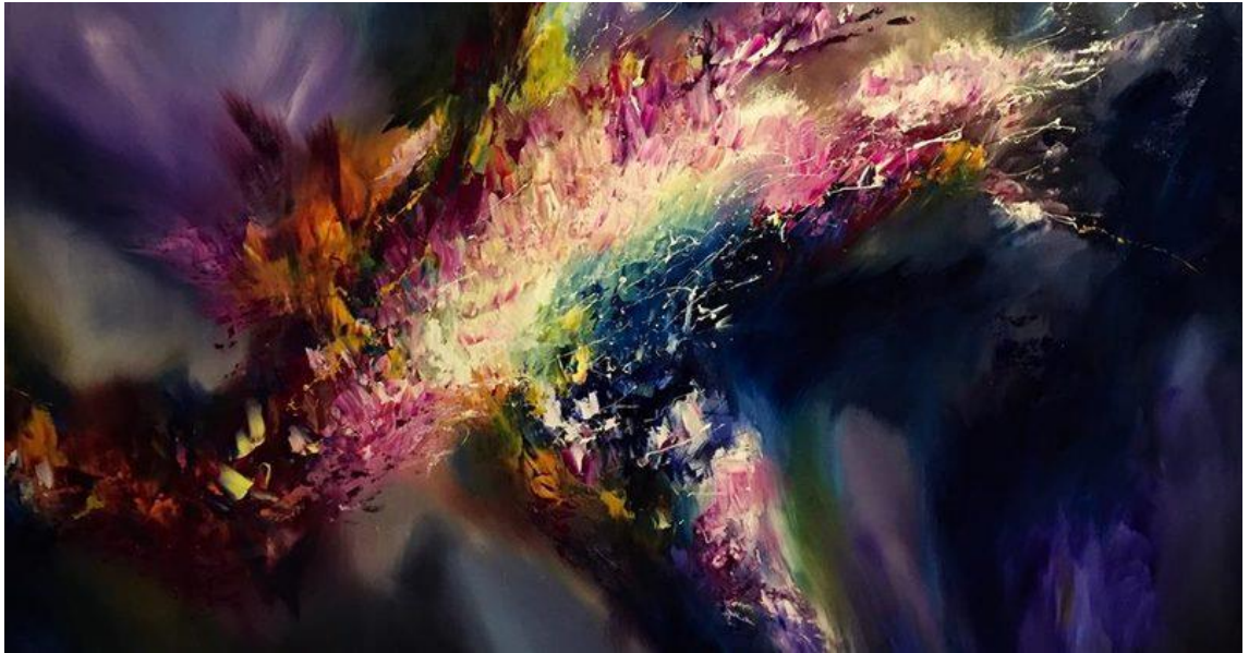
Liite 2 Taru haili sormivärimaalaus akryyleillä ”The Firebird” (2016)