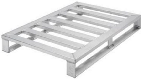
Figur 7. Aluminiumpall från IP Group