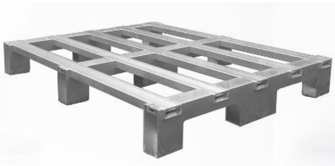
Figur 8. Stålpall från PZ Metal Pallets

Av metallpallarna är aluminium och rostfritt stål de dyrare modellerna, och priset stiger ju tyngre lastpallen är. De svagare metallpallarnas pris är jämförbart med plastpallar, medan metallpallar av hög kvalitet kan kosta 200 euro eller mer per styck. (LeBlanc, R. 2016)