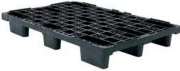
Figur 6. Plastpall från Goplasticpallets.com (Goplasticpallets.com)