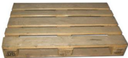
Figur 2. Träpall från Suomen Lavacenter (Suomen Lavacenter)

Träpallar har dominerat marknaden sedan lastpallar började användas inom materialhantering (Masood, S. & Haider Ritzvi, S. 2006). Träpallen karakteriseras ofta som billig, återanvändbar och återvinnbar (O'Reilly, J., 2011). Vid internationella transporter bör träpallarna behandlas för att skadeinsekter inte skall spridas mellan länder (Mazeika Bilbao, A. & Carrano, A.L, et. al. 2011, s. 1226). Träpallens vikt kan variera med några kilogram beroende på använt trämaterial och ifall pallen är fuktig.