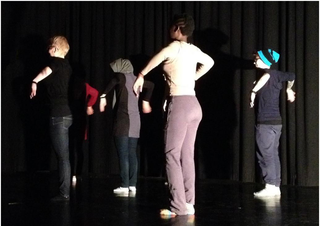
Kuva 4. Monikulttuurisessa ryhmässä yhteinen kieli voi löytyä liikkeestä.

Etnosentrismi eli etnokeskeisyys on kolmas modernistiseen ihmiskäsitykseen liittyvä keskeisajattelun muoto. Etnosentrismi tarkoittaa ajattelua ja toimintaa, joka asettaa oman kulttuurin muiden kulttuurien yläpuolelle. Rasismi syntyy tämän ajattelukehikon pohjalta. Valkoisen rodun ylivoimainen luonnollistaminen voidaan nähdä paitsi orjakaupan historiassa myös tämän päivän eurooppalaisten asenteissa turvapaikanhakijoita ja pakolaisia kohtaan. Universalismi liittyy läheisesti etnosentrismiin, koska meillä on taipumus ajatella, että se mikä meille on ”totta”, on – tai ainakin pitäisi olla – se ”oikea” totuus kaikkialla maailmassa kaikille ihmisille. Moninaisen, paikallisen kulttuurisen pääoman esilletuominen voikin haastaa etnosentrismiä ja universalismia. Monikulttuuristen ryhmien kanssa toteutettavat projektit voivat aidosti tuoda esiin erilaisten ihmisten tarinoita, tansseja ja musiikkia. Tärkeintä on se, ettei muista kulttuureista tulevia ihmisiä kohdella vain eksoottisina maskotteina, vaan avaudutaan aitoon vuoropuheluun heidän kanssaan. Virkistävää on se, kun erityisryhmän kanssa toteutetussa teoksessa erottelujen sijaan nähdään myös inhimillistä samuutta ihmisten kesken.