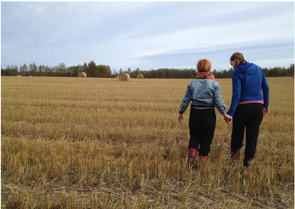
Kuva 5. Tuulenvire kasvoilla, heinäkorsien rahina jalkojen alla, kaverin lämmin ja turvallinen käsi omassa. Taidekasvatus voi olla moniaistista maailman todistamista ilman tarvetta jatkuvaan järkipäristämiseen.

Vaikka taidekasvatusprojektilla ei olisikaan selkeää poliittista agenda sisällöllisesti, esimerkiksi erityisryhmien oikeuksien puolustamista, voi nykytaideteos olla jo muotonsa puolesta radikaali poliittinen teko. Esimerkiksi interventiot julkisiin tiloihin voivat aiheuttaa tunnelman muutoksen ympäristössä ja sitä kautta vaikuttaa ihmisiin kokonaisvaltaisesti. Tunnelma koetaan aina välittömästi, eikä vasta käsitteellisen, järkipärisen ajattelun kautta. Todistaessaan taideteoksen luomaa tunnelmaa katsoja todistaa maailmaa sellaisenaan; hän ei arvioi teosta käsitteiden ja erilaisten kategorioiden kautta. Nykytaidekasvatus voidaan nähdä filosofian harjoittamisena, jossa kiinnostus suuntautuu ontologisiin eli olemassa olon kysymyksiin. Taidementioit voivat auttaa meitä näkemään asioita eri tavoin. Ne voivat auttaa meitä kommunikoimaan yli kieli- ja kulttuurirajojen, ja täten nostaa esiin uudenlaista tietoa ja kokonaisvaltaista ymmärrystä erilaisista ihmisistä ja moninaisesta maailmastamme.