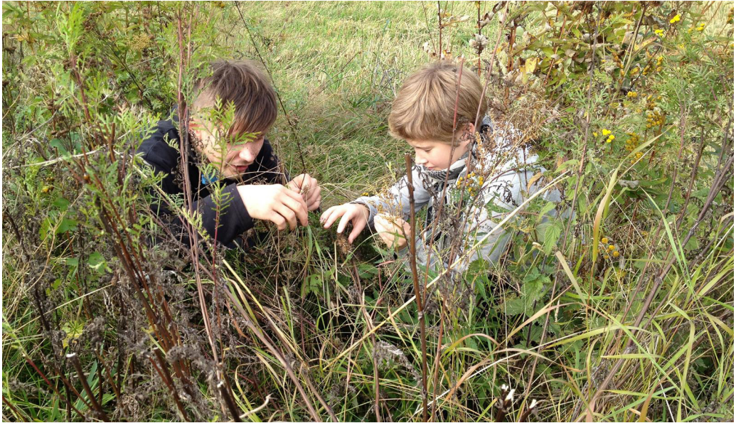
Kuva 3. Hiljentymällä ja sulkemalla silmät voimme opetella tarkastelemaan ympäristöämme muidenkin aistien kuin vain hallitsevan näköaistimme kautta.

Konsumerismi eli kulutuskeskeisyys on seurausta globalisaatiosta. Konsumerismi perustuu ajatukseen, että mahdollisimman suuri kuluttaminen on hyväksi taloudelle ja siksi myös ihmisten ja yhteisöjen hyvinvoinnille. Kuluskriittisyys on kuitenkin kasvussa, ja monet ihmiset kyseenalaistavatkin tarvettamme hankkia jatkuvasti lisää materiaalista omaisuutta. Kaupallisuutta ja kuluttamista vastaan voidaan taistella sekä taiteen sisällön että muodon keinoin. Jotkut taiteilijat kritisoivat markkinavoimia ja mainostamista esimerkiksi luomalla vastamainoksia. Taide "objektina" on korvautunut ajatuksella taiteesta "prosessina". Kuvataidekaan ei enää tarkoita vain myytäviä esineitä, kuten tauluja tai veistoksia, vaan yhä useammin kuvataiteilija luo installaatioita tai performansseja, jotka kutsuvat taiteen vastaanottajan kokemaan läsnäoloa yhdessä taiteen kanssa. Immateriaaliset eli aineettomat teokset elävät vain esityshetkellään.