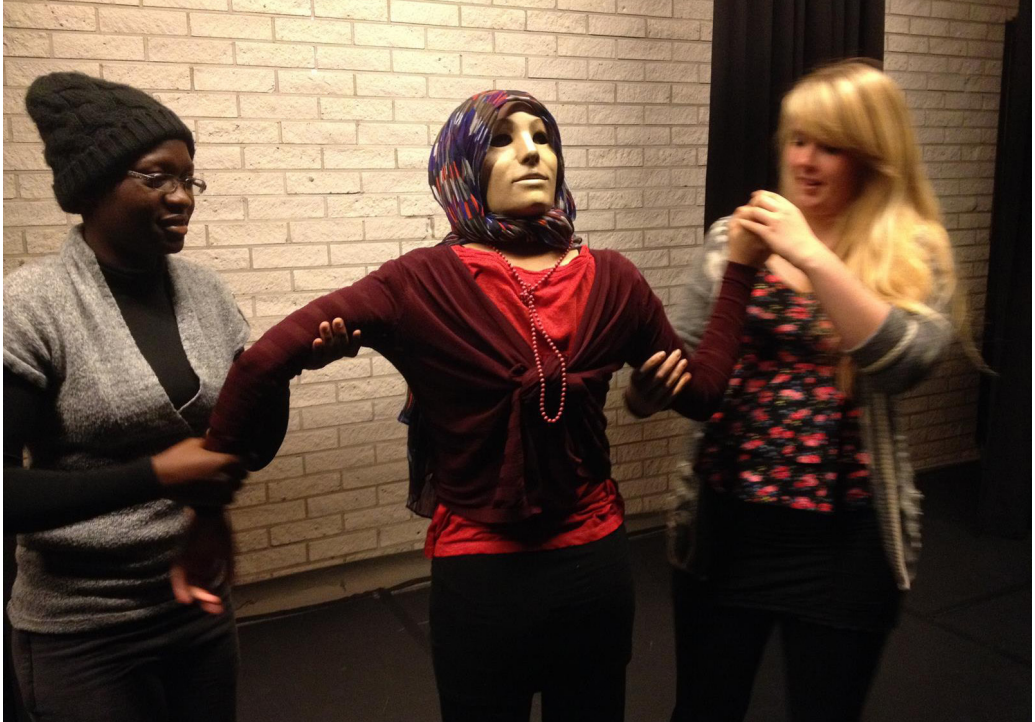
Kuva 1. Teatteriesitys voi syntyä ilman käsikirjoitusta yhdessä ennakkoluulottomasti improvioiden. Teatteri-ilmaisuopiskelijat kokeilivat yhdessä vaihto-opiskelijoiden kanssa naamioteatterin mahdollisuuksia.

esimerkiksi siten, että ohjaaja ei vain ohjaa näyttelijöille valmiiksi kirjoitettua näytelmätekstiä, vaan hän valmistaa esityksen yhdessä ryhmänsä kanssa alusta alkaen. Myös kuvataiteissa erilaiset taiteilijakollektiivit ja anonyymit katutaiteilijat ovat yleistyneet taidekentällä.