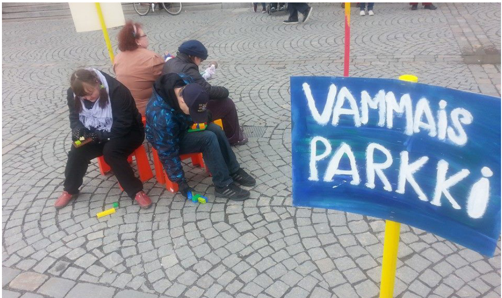
Kuva 1. Taideverstas Wärjäämön draamaryhmän näyttelijöitä esiintymässä W.O.M.-projektin performanssissa "Vammaisparkki" Tampereen keskustorilla keväällä 2015. Kuva: Jarmo Skön

Tämän periaatteen takia olenkin halunnut tehdä työtä paljon myös erityisryhmien kanssa. En oikeastaan edes ajattele enää mitään ryhmää erityisenä. Ikä, vamma, ominaisuus tai henkilökohtainen tausta eivät määritä itsessään taidetyöskentelyn laatua. Oma intohimoni on työkennellä rajoja rikkovasti, uskaltaa kurkistaa ihmisten kanssa yhdessä taiteen kautta maailmoihin, jotka auttavat meitä näkemään ja ymmärtämään toisiamme. Uskonkin, että ihmisten erityisyydestä nousevan moniäänisyyden kautta taiteessa on mahdollisuus löytää uusia, tutkittomia tasoja, jotka tekevät kohtaamisesta taiteen ääressä mielenkiintoisempaa.