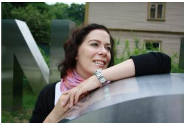
Artikkelin kirjoittaja Anna Laakkonen

Kiitos ja kumarrus Oppiva kirjasto -verkoston puolesta ja tervetuloa mukaan toimintaan! Hyvää joulun odotusta ja nähdään jälleen vuonna 2014!