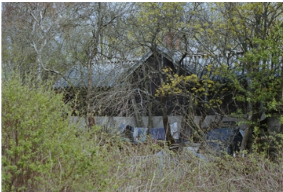
Kuva 5. Miina Puolitaival: Nimetön. Näky, joka vaati tulla kuvatuksi.