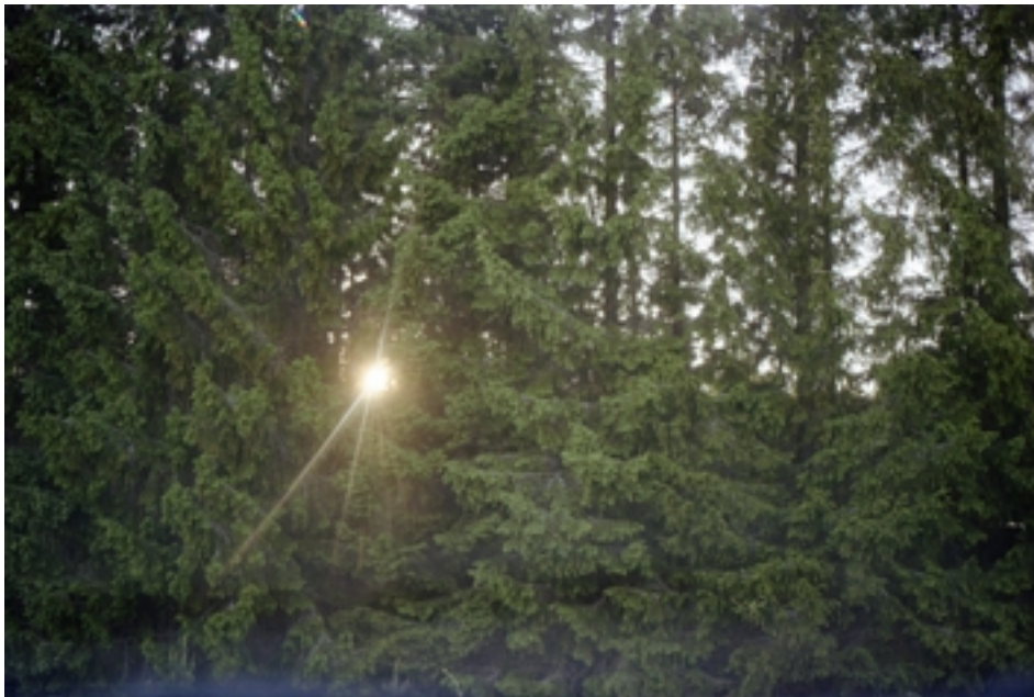
Kuva 6. Miina Puolitaival: Kirkkaudesta. Näky, jonka löysin.