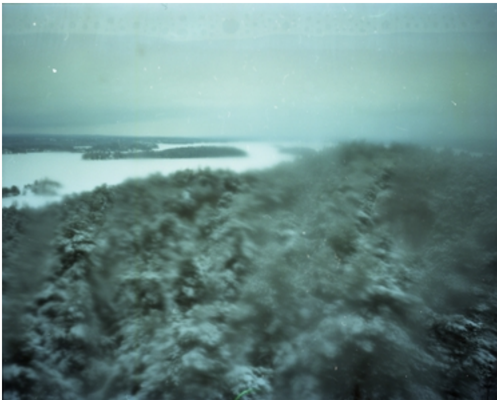
Kuva 1. Miina Puolitaival: Nimeämätön.