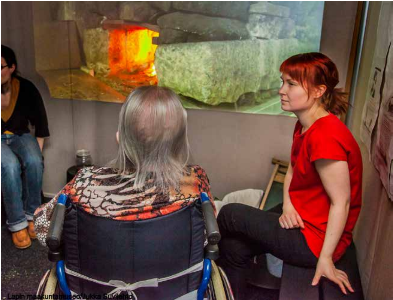
Kuva: Rovaniemen sauna-aiheisessa teltassa kerättiin muistoja.

vertikaaliseen. Yhteisön jäsenten sisäinen dialogi kuvataan horisontaalisena. Olennaista on myös dialogi, joka tapahtuu yhteisön ja sen toimintaympäristön välillä, sillä yhteisön kehittyminen ja kyky kulttuurin luomiseen syntyy sen kommunikoinnista toimintaympäristön kanssa. Tällainen dialogi on vertikaalista.