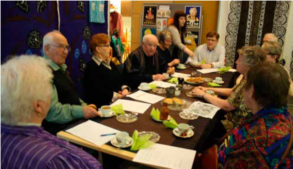
Muistelua voidaan toteuttaa sekä yksilö- että ryhmäkohtaisena. (Liikanen 2007, 160)

Moniaistisen tilan rakentamisprosessi voi olla pienen ryhmän yhteinen muisteluprosessi, jossa muistelutyön tuloksista rakennetaan moniaistinen ympäristö. Toisaalta valmis tila voi toimia inspiroivana miljöönä muistelulle ja sadu- tukselle (storycrafting). Eri sukupolvien kohtaamispaikkana moniaistinen tila, vaikkapa 1950-luvun henkinen suomalaisen koti, toimii ajatuksia herättävänä ja kokemusten jakamista innoittavana ympäristönä. Muistelua ei tarvitse rajata vain ikäihmisten kanssa tehtäväksi työmenetelmäksi – muistelu yhdistää ja voimaannuttaa eri-ikäisiä ihmisiä ja muistojen jakaminen toimii erinomaisesti myös sukupolvia yhdistävänä toimintana.