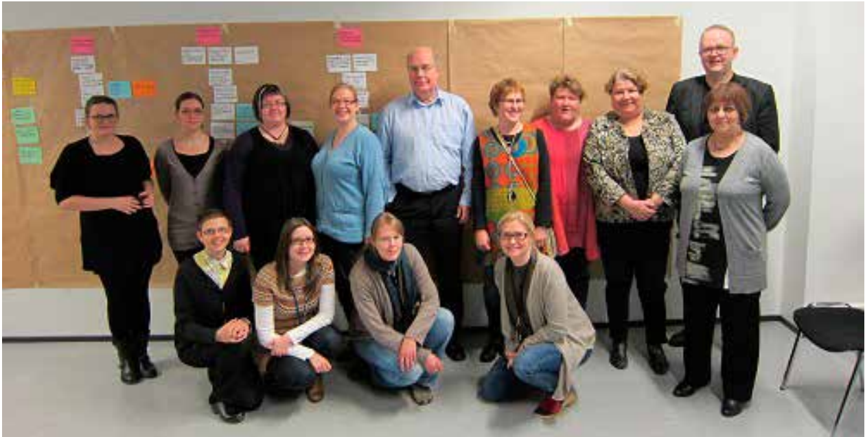
Hankkeen projektiryhmä kokoontui Vantaalla marraskuussa 2012.

Moniaistinen tila kyläsuunnittelun välineenä