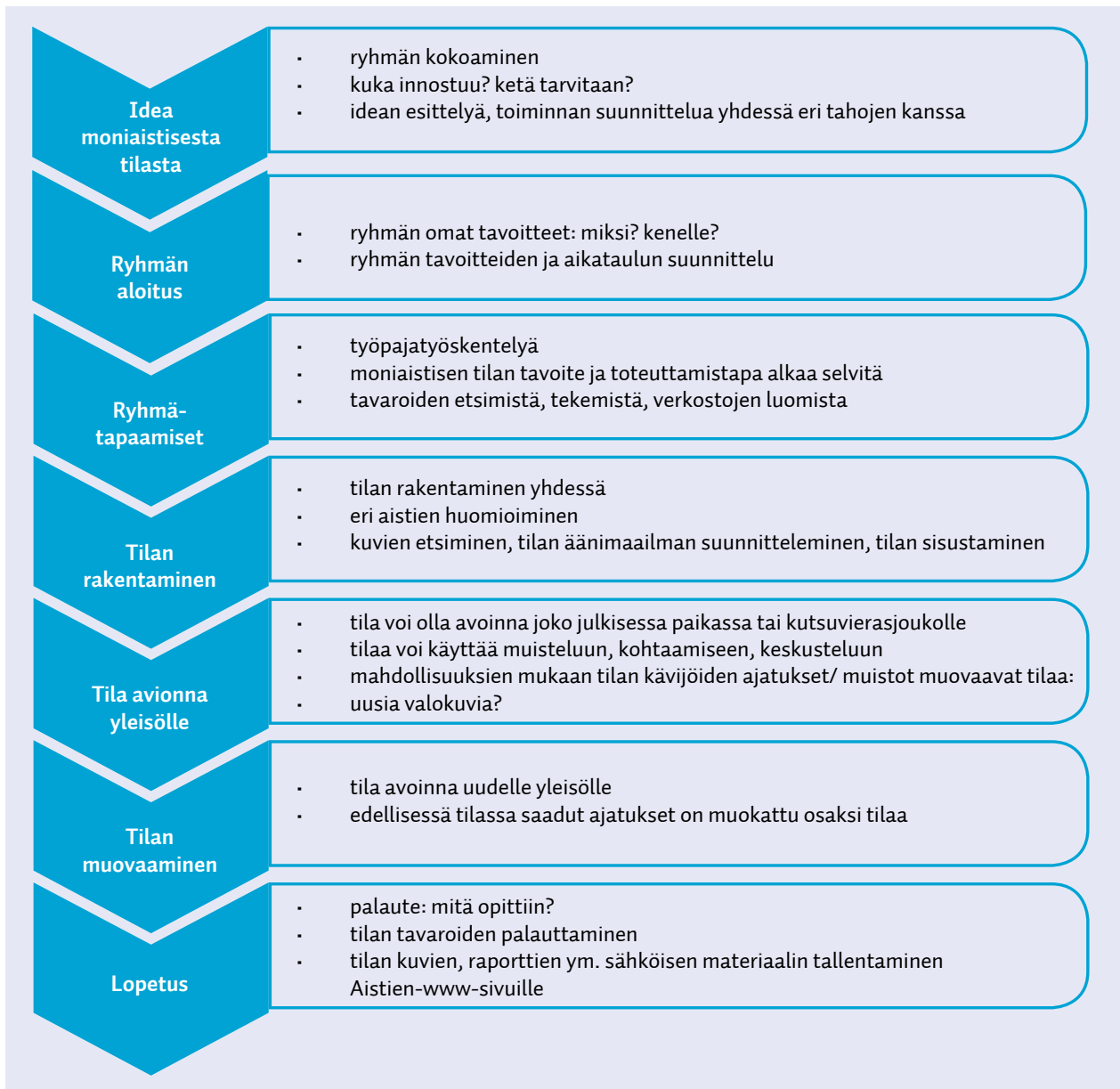
Kuvio: Moniaistisen tilan suunnitteluprosessi

Kannattaa myös sopia, missä vaiheessa rakentamiseen voi tulla uusia ihmisiä mukaan: tehdäänkö koko prosessi saman ryhmän voimin, vai houkutellaanko jossain vaiheessa lisää ihmisiä mukaan.