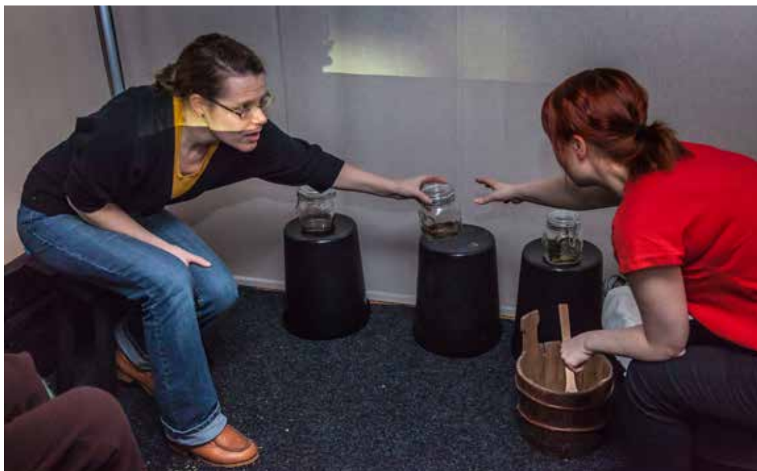
Saunan tuoksut kiersivät saunatilassa lasipurkeissa.