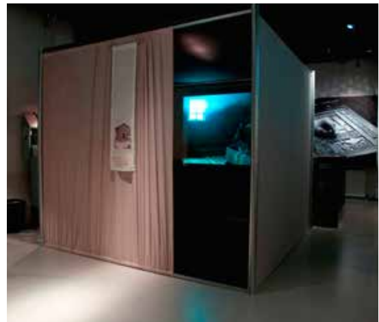
Seinämäratkaisua käytettiin myös Lapin maakuntamuseon sauna-aiheisessa muistelutilassa.