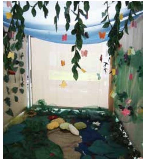
Seinämaratkaisu: Satuteltan rakennusvaihe sekä valmis satuteltta.