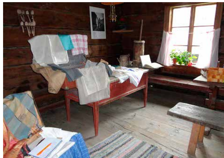
Hämeen Kylät ry:n pilotissa Aistien-tila rakennettiin Hauholla sijaitsevaan kotimuseoon.