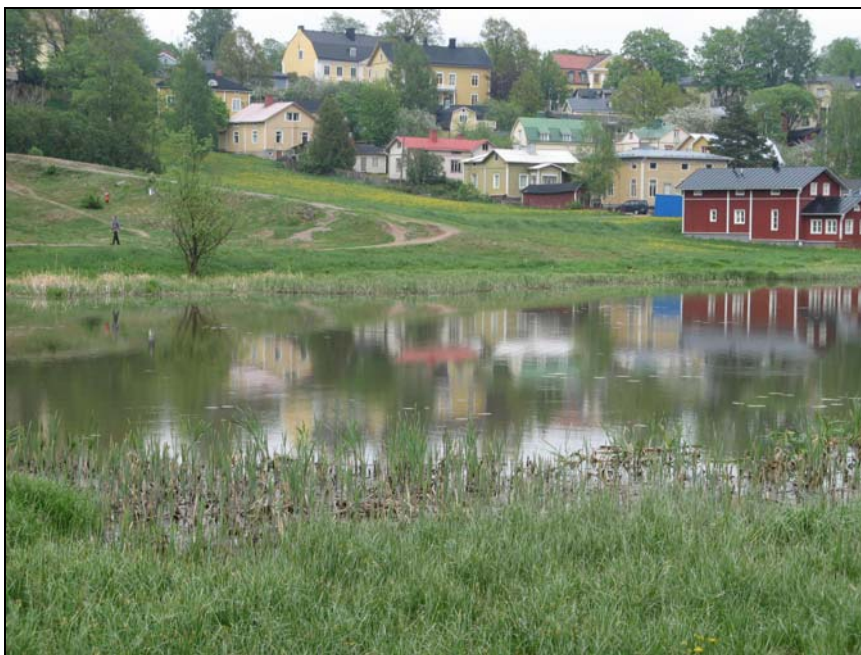
Kuvio 3. Vanhan Porvoon kuvankaunista maisemaa

vaittavissa. Vanhassa Porvoossa ainoa keskiajalta säilynyt rakennus on kaupungin keskeisellä paikalla oleva kivikirkko eli tuomiokirkko (Louhenjoki-Schulman & Hedenström 2003, 63).