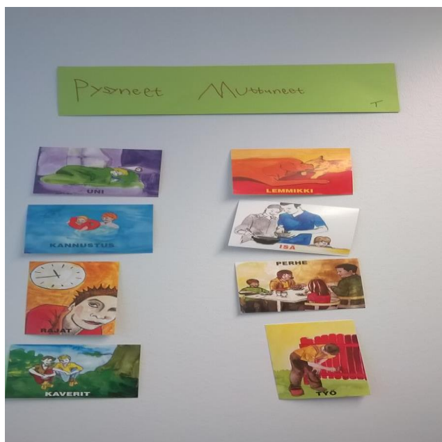
Kuva 3. Pysyneet ja muuttuneet asiat.

Keskustelimme ryhmässä, onko heillä tietoa, miksi osa lapsista ei voi asua kotona, vaan tarvitsevat sijaisperheen. Kaikilla lapsilla oli hyvä käsitys asiasta, ja he kertoivat että tieto tästä asiasta on Pride-valmennuksen aikana käydystä lasten paneelista, sekä keskusteluista vanhempien kanssa. Ryhmässä nousi myös esiin, että miten he kertovat omille kavereille sekä kodin ulkopuolisille ihmisille kuka heidän perheeseen muuttanut lapsi on, ja miksi lapsi asuu heillä. Myös nuoret lapset ajattelevat paljon asioita, ja heillä on myös hyvä käsityskyky asioille. He, joilta oli kysytty, olivat sanoneet että kyseinen lapsi ei voi asua omassa kotona, mutta hän ei tiedä miksi, koska äiti ja isä ei ole saanut sitä kertoa, kun se on sellainen salaisuus juttu.