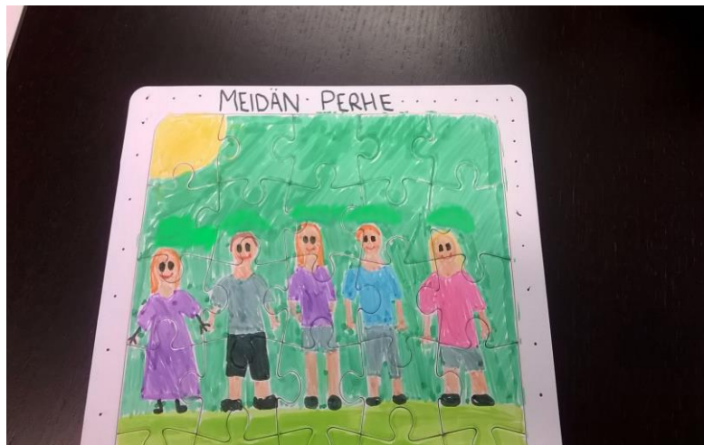
Kuva 4. Palapeli meidän perhe.

Tyhjä palapeli alusta: Perhe lapsen silmin, josta jäi heille myös muisto ryhmän toiminnasta. Itse tehty palapeli jossa oli perheen jäsenet mukana.