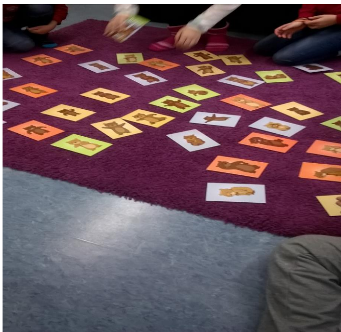
Kuva 2. Nallekorttien etsiminen ”meidän perhe” tehtävään.

Nallekortit: korteissa nallet ilmentävät eri persoonallisuuspiirteitä ja tunteita, ne toimivat lasten kanssa kun käsitellään tunteita, perhe-elämää ja ihmissuhteita. Korttien avulla voidaan käsitellä muutoksia ja avata vuoropuhelun. (pesäpuu 2016) Näillä korteilla hahmotimme perheen tunnelmaa ja dynamiikkaa lasten silmin.