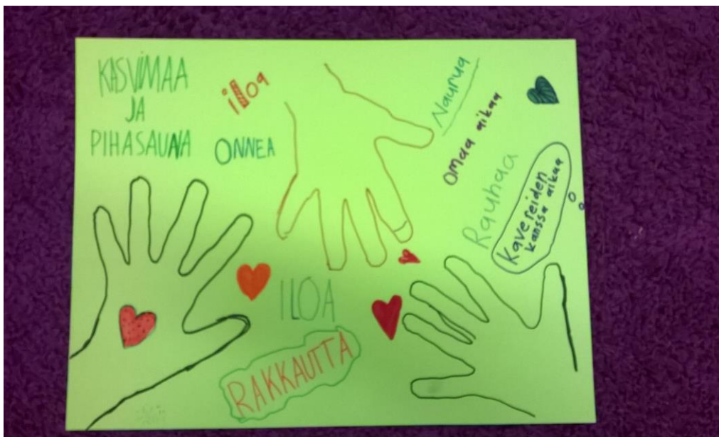
Kuva 5. Toive vanhemmilta

Lopussa lapset saivat ryhmässä piirtää vanhemmille. Aiheena oli, ”toive vanhemmilta”