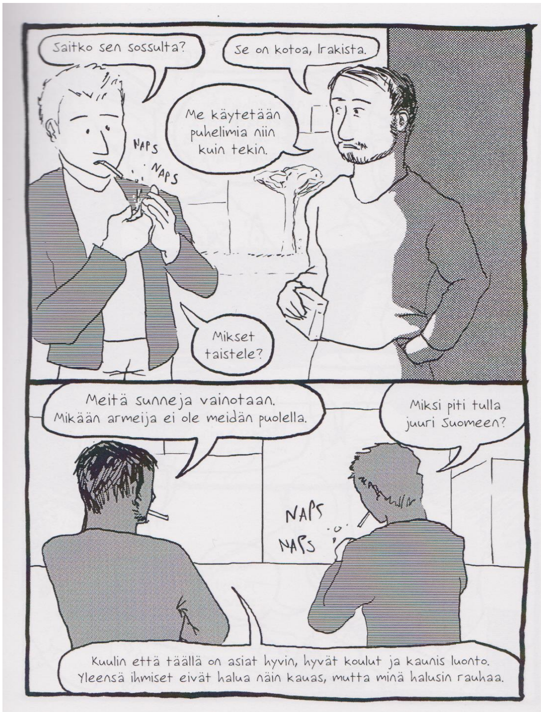
KUVA 1. 24 päivää (Nyyssölä ja Vieruaho 2016, 15.)