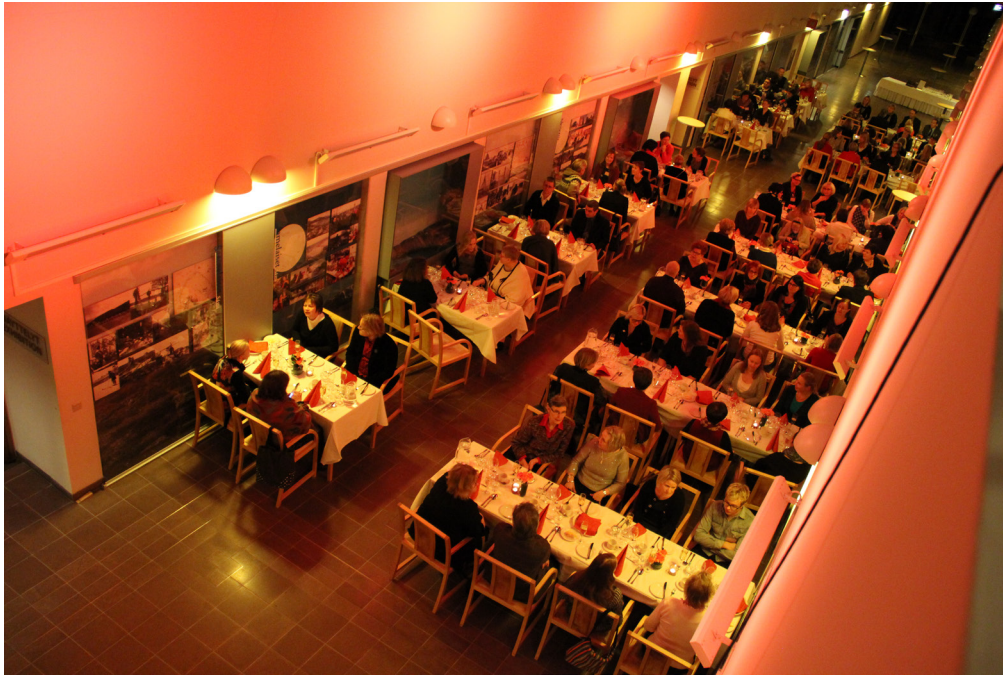
Kuva 1. Kielten ja viestinnän opettajia neuvottelupäivillä Rovaniemellä vuonna 2014