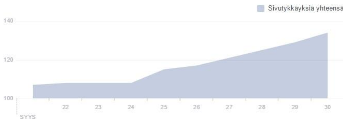
Tykkäyksiä toivottu kasvusuunta Nurmijärven Siskojen ja Simojen Facebook sivuilla syyskuussa 2016 viikko talkoiden aloituksen jälkeen

Talkoiden päättymisajankohta jätettiin tietoisesti avoimeksi, koska etukäteen oli mahdoton tietää, kuinka talkoot onnistuvat. Aloituspalaverissa nostimme ajatuksena ilmaan, että mahdollisesti helmikuun loppuun mennessä saisimme jakaa viimeiset sukat esikoululaisille ja ehtisivät vielä hetkeksi talvipakkasille käyttöön. Esitteeseen emme kuitenkaan lopetuspäivämäärää merkanneet ja päätimme elää tilanteen mukaan. Tämä järjestely sopi myös keräyspisteinä toimiville kirjastoille.