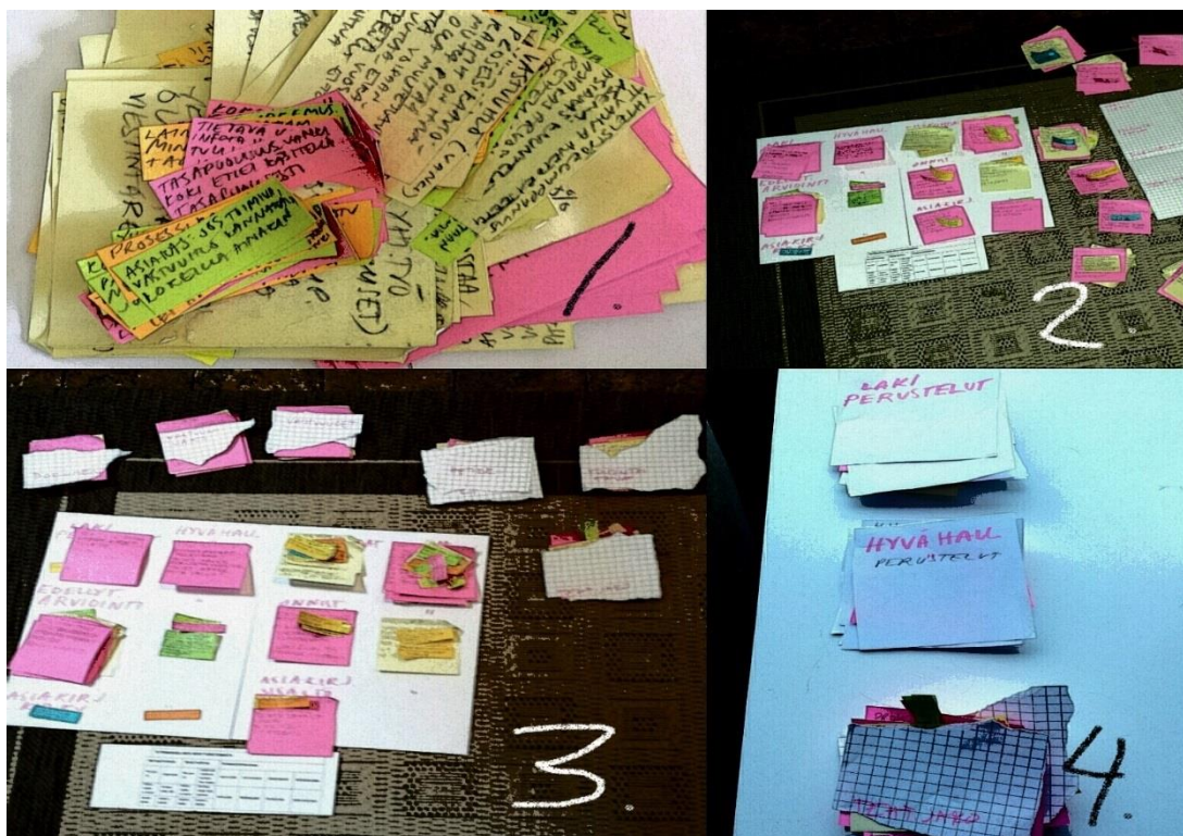
Kuva 1: Haastatteluaineiston analysoinnin vaiheet