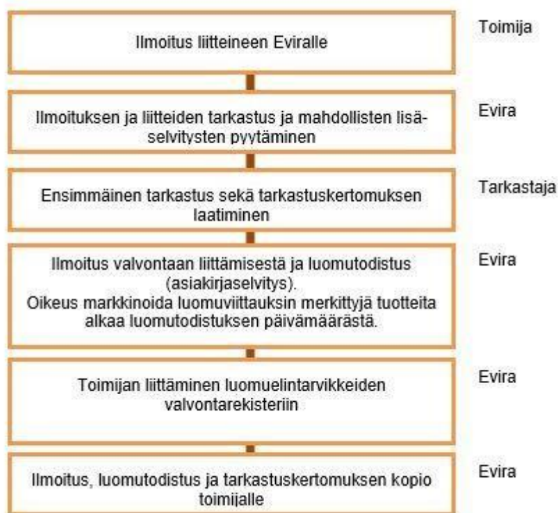
KUVIO 1. Hakuprosessi (Evira: Luomutuotanto 3, Elintarviketuotannon ehdot 2016, 9)

Euroopan Komission asetus 889/2008 vaatii luomutoimintaa harjoittavalta toimijalta luomusuunnitelman laatimisen. Ohjeita luomusuunnitelman laatimiseen löytyy Eviran tekemästä elintarvikekohtaisesta luomusuunnitelmaohjeesta. ( https://www.evira.fi/globalassets/yhteiset/luomu/luomun-lomakkeet/18239_2_luomusuunnitelma_elintarviketoimijoille_2013.pdf ). Valmiit hakudokumentit lähetetään Eviralle, jolloin liittymisprosessi saadaan käyntiin (kuvio 1).