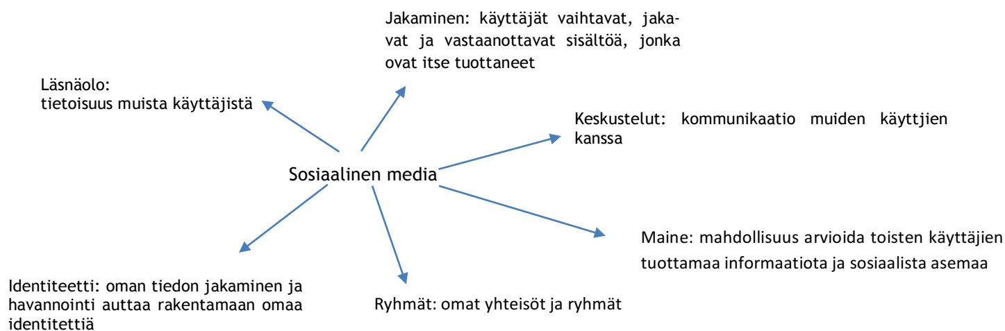
Kuvio 2: Sosiaalisen median osatekijät (Mäntymäki 2012, 10)

Hyvä sosiaalisen median käyttäjä tunnistaa itsensä jokaisesta kohdasta ja osaa työskennellä ja esimerkiksi tuottaa sisältöä ottaen huomioon jokaisen osatekijän.