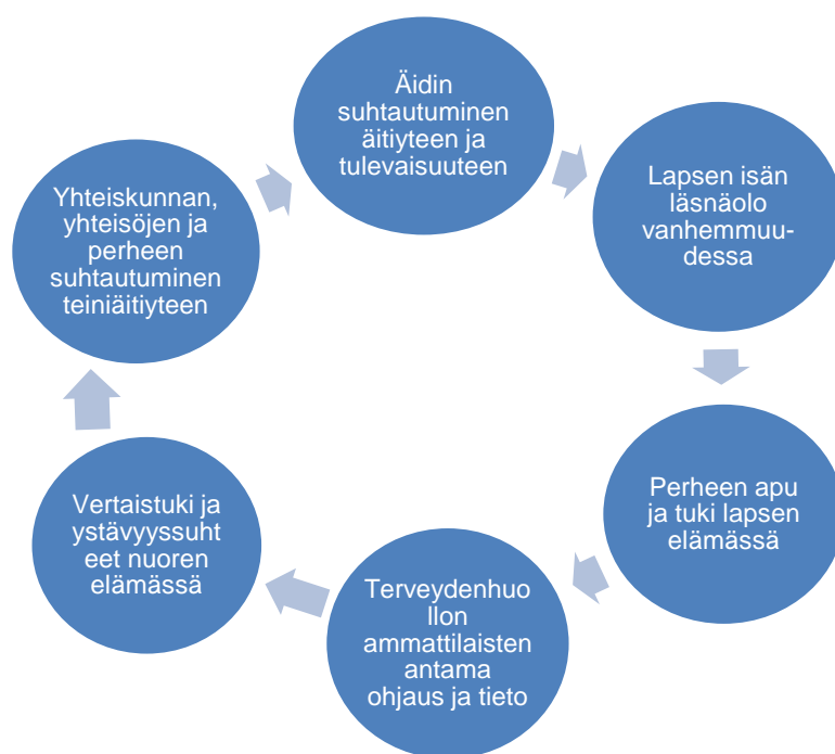
Kuvio 4. Tutkimuskysymyksiin vastaavat tulokset.

Opinnäytetyöni tavoitteena oli selvittää tekijöitä, jotka tukevat nuorten äitien vanhemmuuteen kasvua. Työni tuloksista nousi suoraan teemoja liittyen nuorten äitien vanhemmuuden tukemiseen ja tulokset vastaavat suoraan tutkimuskysymyksiini. Tutkimustulosten perusteella näiden nuorten naisten vanhemmuutta edistävät tekijät liittyivät äitien omiin asenteisiin ja kokemuksiin, sosiaalisiin verkostoihin ja terveydenhuollon ammattilaisten palveluihin.