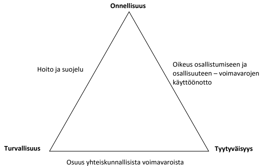
Kuvio 1. Lasten subjektiivisen hyvinvoinnin kolmio (Vornanen 2001, 27) mukailten.