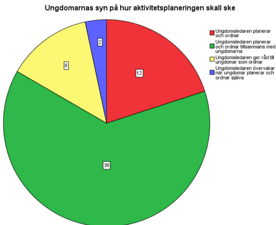
Figur 1 Ungdomarnas syn på hur aktivitetsplanering skall ske

att de tycker om att titta på serier och film och spela tv-spel. Även för målgruppen illegala aktiviteter, så som alkohol- och nikotinanvändning, dök upp bland svaren. Resultaten i diagrammen anges i antalet respondenter som har svarat.