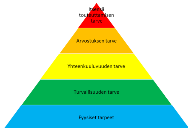
Kuva 2: Maslowin tarvehierarkia pyramidi Rauramo, 2008

Kuten aiemmassa tekstissä todettiin, ihmisellä on tarve kehittää ja toteuttaa itseään, sekä saada osakseen arvostusta voidakseen hyvin. Tästä voidaan päätellä, että ollakseen työelämässä hyvinvoiva ja tehokas, henkilön on saatava kehittää itsenään. Työn mielekkyys ja siitä saatu arvostus selkeästi vaikuttaa yksilön motivaatioon