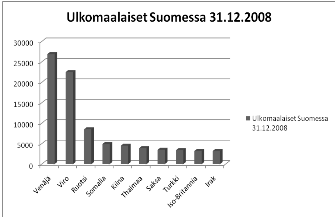
Kuvio 1. Ulkomaalaiset Suomessa 31.12.2008 – suurimmat kansallisuusryhmät Lähde: Maahanmuuttovirasto 2009

Suurimmat ulkomaalaisten ryhmät Suomessa vuonna 2008 olivat venäläiset (26 900), virolaiset (22 500), ruotsalaiset (8 500), somalit (4 900), kiinalaiset (4 500), thaimaalaiset (3 900), saksalaiset (3 500), isobritannialaiset (3 200) ja irakilaiset (3 200). (Maahanmuuttovirasto 2009.)