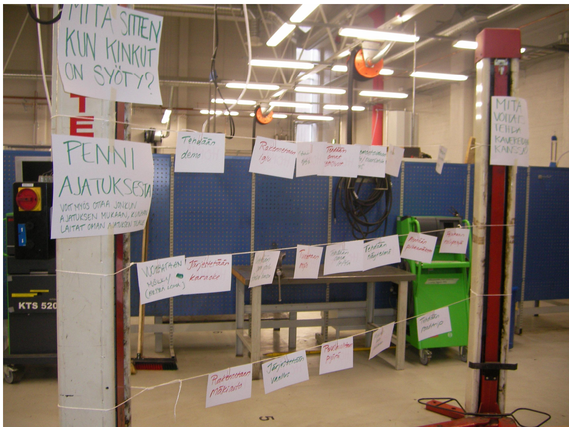
KUVIO 5. Pyykkinarun kokeilua Amis-päivillä 3.12.2009.

Pyykkinarun periaate on lähes sama kuin Ideaseinässä. Nuoret voivat kirjoittaa vastauksensa kysymykseen ajatuspaperille ja ne voidaan koota roikkumaan pyykkinarulle kaikkien nähtäville. Ideana oli, että nuoret voisivat vaihtaa ajatuspapereita. Löytäessään ajatuksen, joka heitä miellyttää, he voivat viedä paperin mukanaan jos kiinnittävät sen tilalle uuden. (kuvio 5)