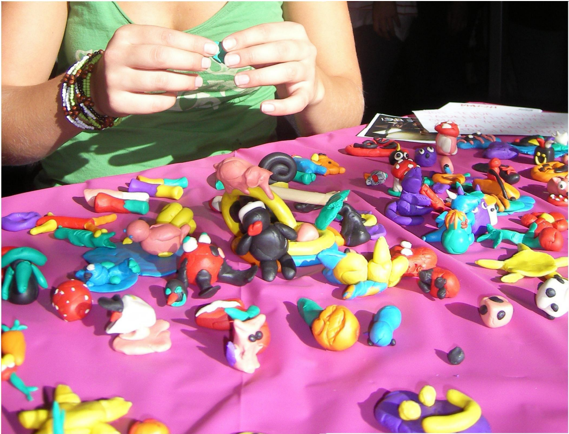
KUVIO 3. Demi-päivän taidenäyttelyä

Ständillä houkuttelimme tyttöjä osallistumaan projektiimme ja teimme itsekin muovailuvahateoksia. Varsinkin alkupäivästä, kun pöytä oli vielä tyhjä, koimme nuorten olevan arkoja aloittamaan taiteilua ilman esimerkkejä ja muiden teosten tuomaa turvaa. Kävi niin, että toinen meistä oli koko ajan pöydän ääressä muovailemassa tyttöjen kanssa ja herättelemässä keskustelua Nuorten Akatemiasta sekä Homma-rahasta. Nuoret olivat vastaanottavaisia, mutta meille jäi kuva, että projektinäkökulma jäi kivan tekemisen alle. Tämä vaatii työntekijältä taitoja keskustella nuorten kanssa, jotta Nuorten Akatemian sanoma välittyy paremmin.