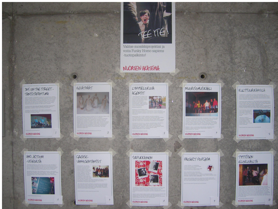
Projektitaulut esillä Demi-päivänä 26.9.2009.