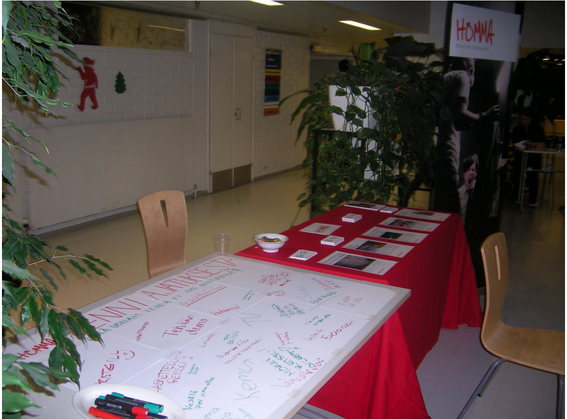
KUVIO 4. Ideaseinän kokeilua Amis-päivillä 1.12.2009.

Ideaseinää kokeilimme ensimmäisenä messupäivänä Haagan ammattikoulun tiloissa 1.12. Käytössämme oli kaksi pöytää, joista toiselle teippasimme papereita suureksi ”seinäksi” ja kirjoitimme otsikoksi ”Penni ajatuksesta”. Alle kirjoitimme kysymyksen ”Mitä voitais tehdä, että olis kivempaa?”. Toiselle pöydälle asetimme kulhon suklaarahjoja sekä Nuorten Akatemian esitemateriaalia. Messuilla oli näytteilleasettajia esimerkiksi Metalliliitosta, Tyttöjen talosta ja Hartwallilta. Tapahtuman oli pääasiassa järjestänyt koulun opiskelija, joka oli käynyt Nuorten Akatemian järjestämän projektikoulutuksen. (kuvio 4.)