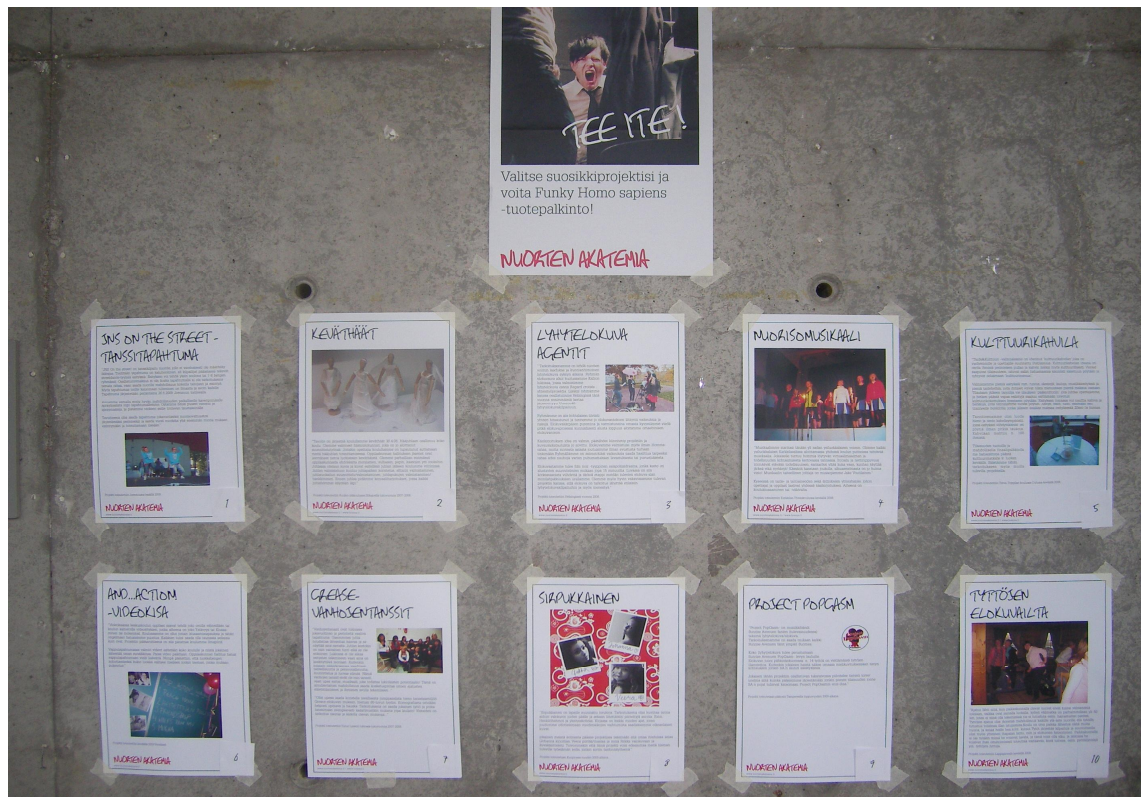
KUVIO 2. Projektitaulut esillä Demi-päivänä.

lisäksemme tuote-esittelijöitä esimerkiksi Revlonilta ja L’Orealilta sekä järjestöjä kuten Plan.