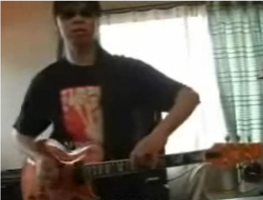
Kuvankaappaus youtube videosta.

Valitettavasti en voi tähän upottaa videota enkä voi kirjaimin välittää sitä mitä tuo soitto on. Taganawan soittovideo löytyy youtubesta. (Youtube, Hiroaki Tagawa)