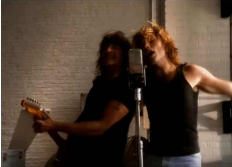
Kuvankaappaus Bon Jovin musiikkivideosta Always .

Analysoin vielä yhtyettä nimeltä The Doors . Supersuosittu yhtye jonka laulaja Jim Morrison on edelleen vuosikymmenten jälkeen kuolemastaan rockin ja seksin symboli. Jim Morrisonin kuoli vuonna 1971 ja mitä orkesterin levyjä ostavaan yleisöön tulee, olisivat muut jäsenet voineet kadota planeetan pinnalta samana vuonna. Vielä tuona samana vuonna The Doorsin jäljelle jääneet kolme jäsentä julkaisivat levyn. Eivätkä jäsenet yrittäneet piilotella sitä, ettei Morrison enää ollut yhtyeessä, mikä tuodaan esille mm. albumin kantaessa nimeä Other Voices . Myöhemmin yhtye teki vielä toisen levyn nimeltä Full Circle seuraavana vuonna, mutta menestys jäi huonoksi. Tämän jälkeen yhtye ymmärsi, ettei he selvästi kiinnostaneet yleisöä ilman Morrisonia. Näinpä he keksivät tehdä levyn missä käytännössä tehtiin musiikkia Jim Morrisonin vanhojen runojen päälle ja mihin kaivettiin vanhoja nauhoituksia mihin on tallentunut Morrisonin puhetta ja hänen lukemiaan runoja. Olivatpa muut jäsenet miten lahjakkaita tahansa se ei yksinään riittänyt. Kansa halusi Morrisonin eikä muut jäsenet kiinnostaneet ketään, vaikka he olivat toki taitavia ja musiikillisesti persoonallisia.