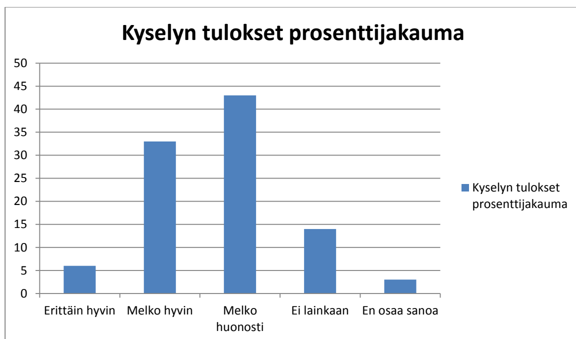
KUVIO 4. Työhyvinvoinnin ja jaksamisen edistäminen. (STTK:n Aula researchilta tilaama kysely 2017.)

Tutkimuskysymyksenä oli edistetäänkö työpaikallasi suunnitelmallisesti työssäjaksamista ja työhyvinvointia. (STTK:n Aula researchilta tilaama kysely 2017.)