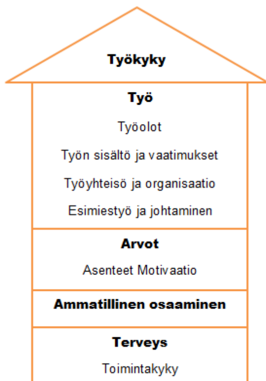
KUVIO 2. Työkykytalo. (Ilmarinen 2006.)

Toimintakyky kuvaa kuinka hyvin ihminen selviytyy päivittäisistä tehtävistä elämässään ja työkyky on yksi toimintakyvyn osa-alue. Siihen vaikuttavat ihmisen omien voimavarojen lisäksi myös työssä tarjolla olevat voimavarat sekä työn vaatimukset. Työkyky voi olla heikentynyt, koska työn vaatimukset ovat kohtuuttomat, työolot ovat huonot tai että ihmisen omat voimavarat ovat jostain syystä vähentyneet. (Ahola 2011, 35.)