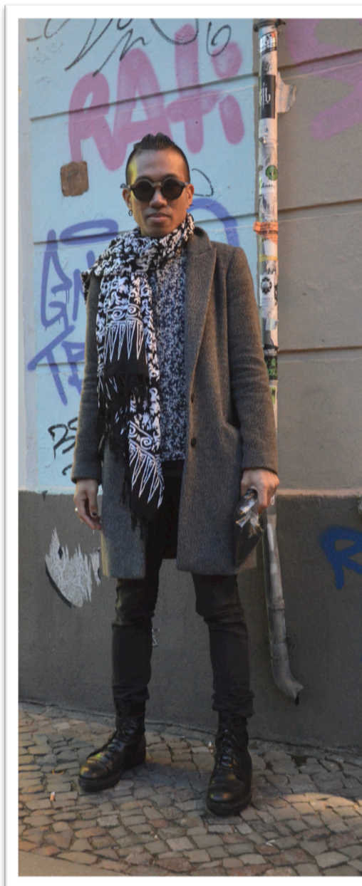
Figur 11. Helkroppsbild