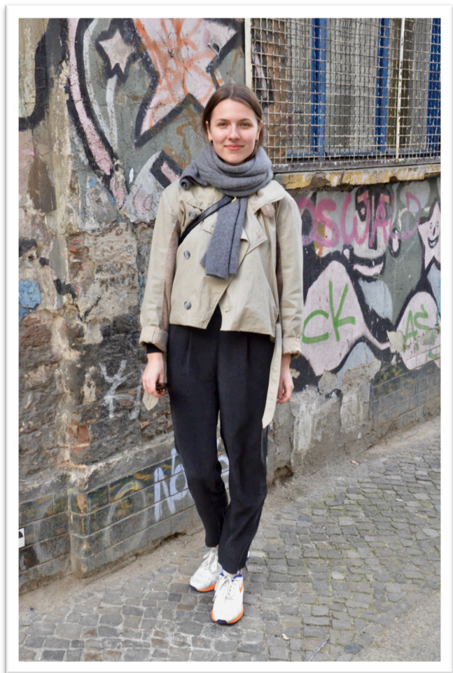
Figur 1. Helkroppsbild