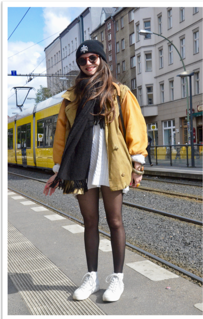
Figur 5. Helkroppsbild