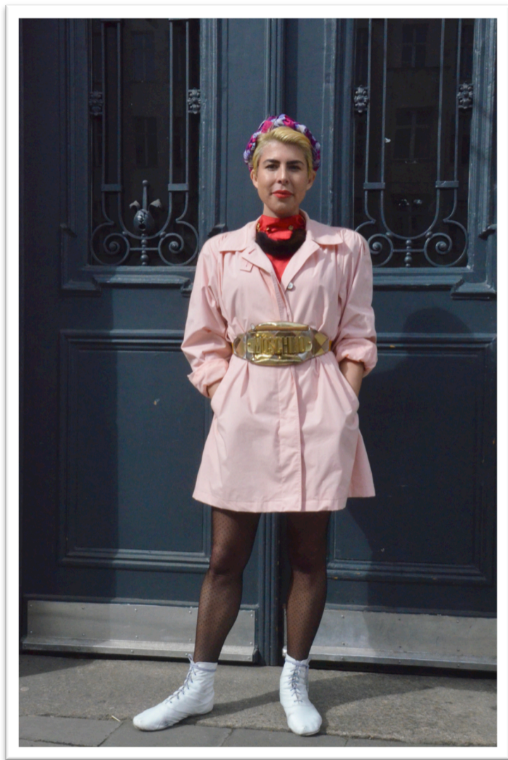
Figur 7. Helkroppsbild