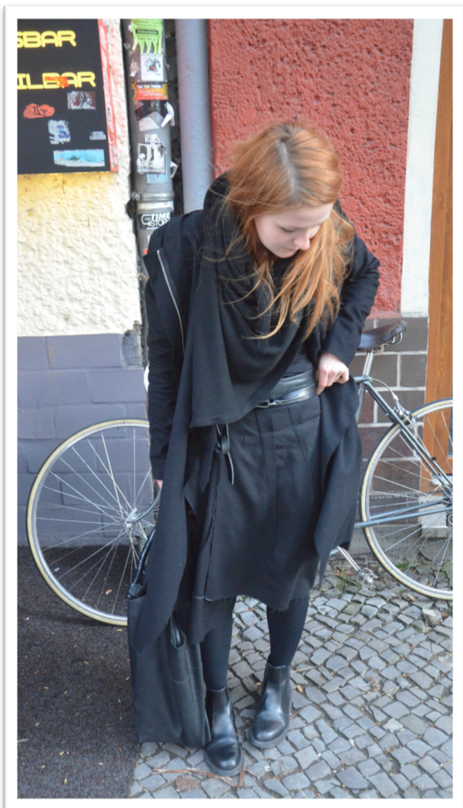
Figur 13. Helkroppsbild