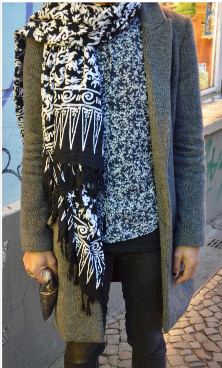
Figur 12. Detaljer

Lope har på sig ett par svarta Yohji Yamamoto Adidas-skor, svarta vintage-jeans och en grå kappa som är uppknäppt. Under kappan har han en svartvit skjorta med små blommor. Han har en svartvit, mönstrad, stor scarf virad runt halsen och ett par solglasögon från H&M. Solglasögonen har runda bågar.