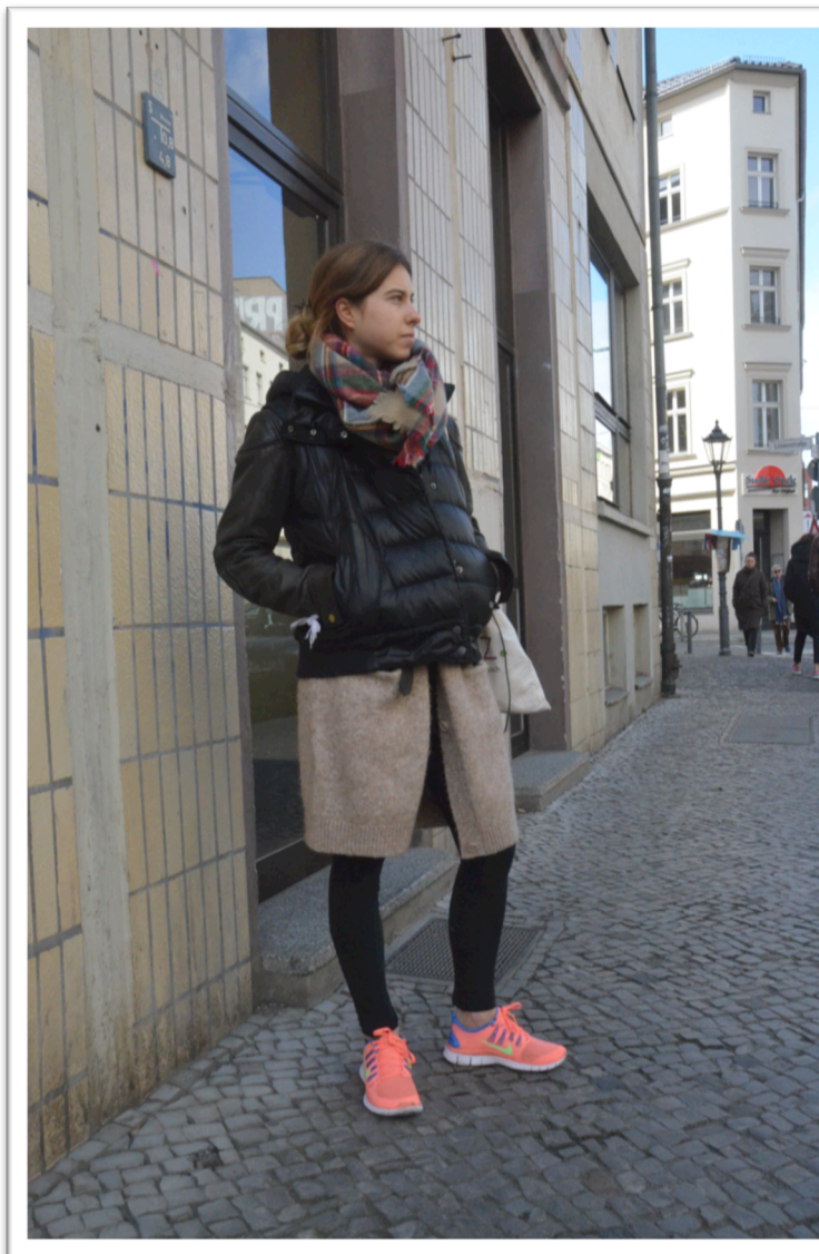
Figur 15. Helkroppsbild