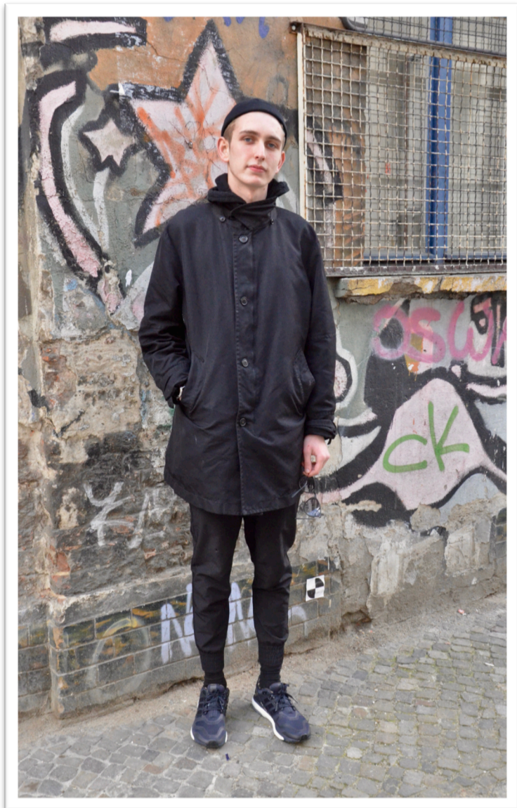
Figur 3. Helkroppsbild