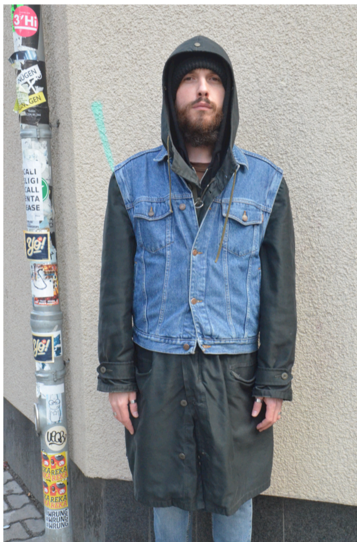
Figur 9. Helkroppsbild