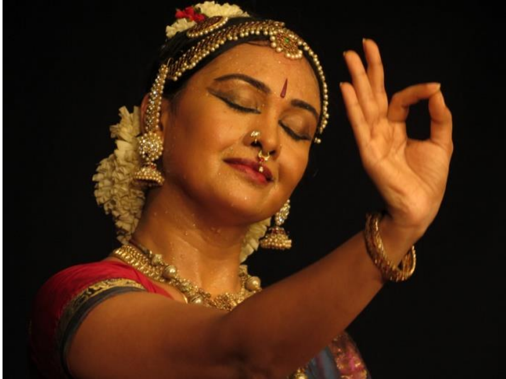
Kuva 10: Hamsasyam-käsimerkki Bharata Natyamissa

Esimerkiksi Bob Fosse otti paljon vaikutteita Colelta. Sitä nähdään Fossen työssä esimerkiksi pienien yksityiskohtien käytössä. Fossen käyttämä East Indian Hands (McWaters 2008, 9) on lainausta Colen käyttämästä Bharata Natyamista: siinä puristetaan peukalo keskisormen kanssa yhteen ja muut sormet avataan mahdollisimman auki. Fossen ehkäpä kuuluisin käsiasiasto Teacup Fingers (McWaters 2008, 8) on variaatio East Indian Hands -asennosta; molemmat näistä on poimittu intialaisesta tanssiperimästä.