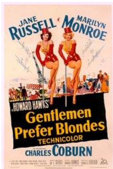
Kuva 2: Gentlemen Prefer Blondes -mainos 1953