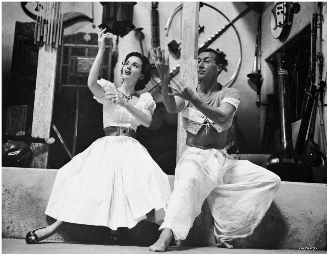
Kuva 3: Kismet 1955 : Jack Cole oikealla. Kismetin elokuvaversiossa hän oli koreografina vastuussa musikaalikohtauksista.