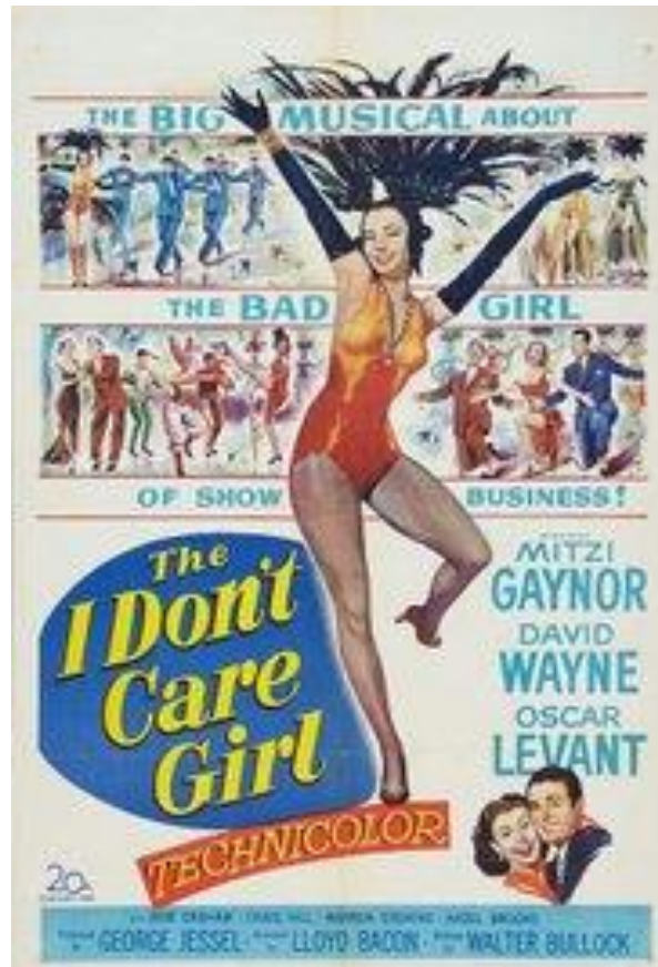
Kuva 4: Elokuvan mainos The I Don't Care Girl 1953

Colella on ollut ilmeisesti suuri mahdollisuus käyttää erilaisia rakenteita, ja sitä hän onkin hyödyntänyt mitä mielenkiintoisimmin. Diagonaalisuuntaan ruudulla oleva pitkä, musta ramppi avaa kohtauksen ja antaa heti kolmiulotteista tuntumaa kameratyön kautta. Ramppia käytetään tietenkin ihmisten kohottamiseen, mutta se toimii samalla näkösuojana ihmisten hävittämiseen rampin rakenteen ja kamerakulman keinoin. Roikkuvat liianit tuovat myös korkeussuhdetta studion kuvauksiin: kaikki ei tapahdu ainoastaan lattiatasolla.