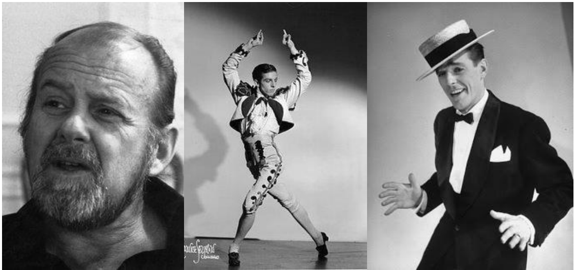
Kuvat 6–8: Kolme kuningasta vasemmalta oikealle: Bob Fosse, Jerome Robbins sekä Gower Champion

Edellä mainituista Jerome Robbins, Bob Fosse sekä Gower Champion muodostivat myöhemmin niin sanottuun Kolmen Broadwayn Kuningaan ( Three Kings Of Broadway ) joukon. Heidän työnsä määritteli, miten tanssi voi ottaa esityksen pääroolin, ja kuinka koreografi voi ottaa johtohahmon ohjaajana ja päättäjänä. (Kislan 1987, 93.)