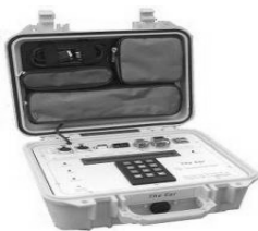
Kuva 3. Ear toimii mattojen ja tietokoneen välillä.

ChampionChip-ajanotossa tarvitaan seuraavia erikoislaitteita: ajanottomatot, Earit, Gigasetit, Yellow boxit, kaapelit ja ajanottosiru. Ear on esitelty kuvassa 3. Yellow box ja matot on esitelty kuvassa 4. [3.]