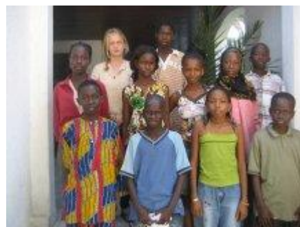
KUVA 1. ja 2. Senegalin mediakeskuksen oppilaita ja postikorttiprojektin osallistujia.