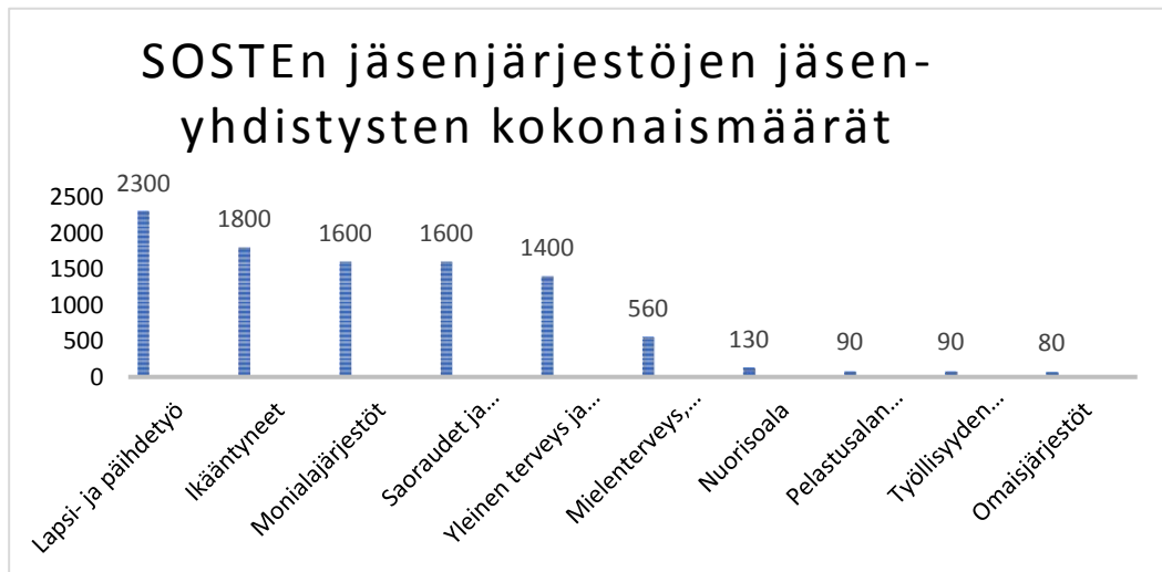
Kuvio 2. Suomen jäsenjärjestöjen jäsenyhdistysten kokonaismäärät (Elinvoimaiset järjestöt.)

Loimun (2010) mukaan Yhdistyksen tunnusmerkit ovat täyttyneet ja yhteenliittymää pidetään yhdistyksenä, kun siinä on vähintään kolme jäsentä. Lisäksi sillä tulee olla jokin aatteellinen tarkoitus ja toiminta, jota se harjoittaa, on tarkoitettu pysyväksi. Jäseninä yhdistyksessä voivat olla luonnolliset henkilöt tai oikeushenkilöt. Jäseninä samassa yhdistyksessä voi olla ihmisiä ja erilaisia yhteisöjä. Aatteellisuudella voidaan laajasti ajateltuna tarkoittaa esimerkiksi jonkin aatesuunnan edistämistä, tietyn ryhmän etujen valvomista, hyväntekeväisyyttä, edunvalvontaa tai vaihtoehtoisesti palveluiden tuottamista jäsenille tai esimerkiksi toisille kolmannen sektorin toimijoille tai yhdessäolon mahdollisuuksien tarjoamista jäsenille. (Loimu 2010 23, 24.) Aatteellisen yhdistyksen tarkoitus ei ole tuottaa voittoa tai muuta taloudellista ansiota jäsenilleen (Tietoa tilastoista.)