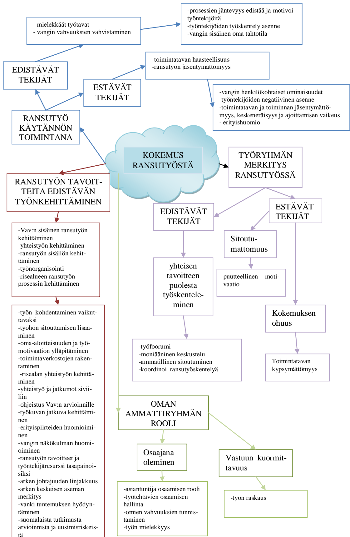
Kuvio 2. Tutkimuksen käsitekartta