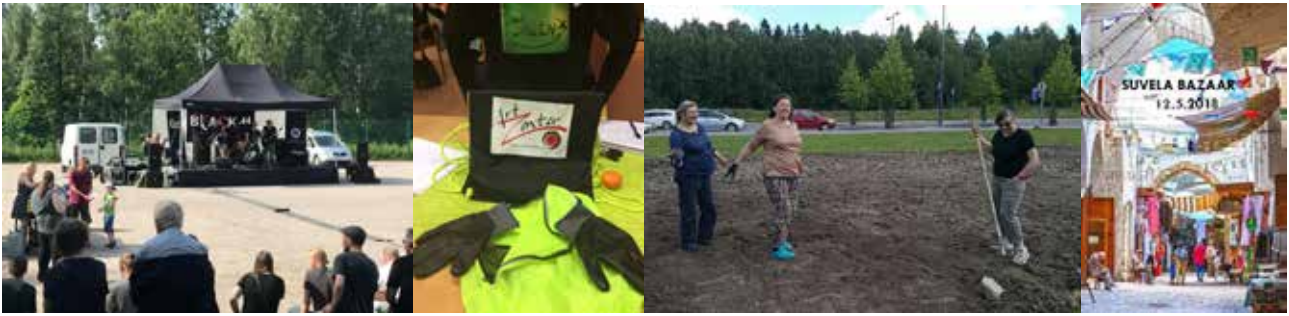
Kuva 4. Mun Idea-kokeilun voittajat. Centtifest (musiikin paikallistapahtuma), Move Green (ympäristöä siistivät parkour-partiot), Kukkaniitty (asukkaiden istuttama kukkaniitty) ja Suvelan basaari (kaupunki- ja kulttuuritapahtuma)

käytettävyyden parantamista sekä pop-up -äänestyskoppimahdollisuutta sen rinnalle. Kansalaissparraajien nostaminen nyt voittaneista asukkaista voisi mahdollistaa seuraavan ideakilpailun tehokkaamman tiedottamisen ja näkyvyyden, ideoiden löytymisen kansan syvistä riveistä, sekä niiden alustavan valmistamisen toteuttamiskelpoiseksi vaikkapa yhdistyksissä.