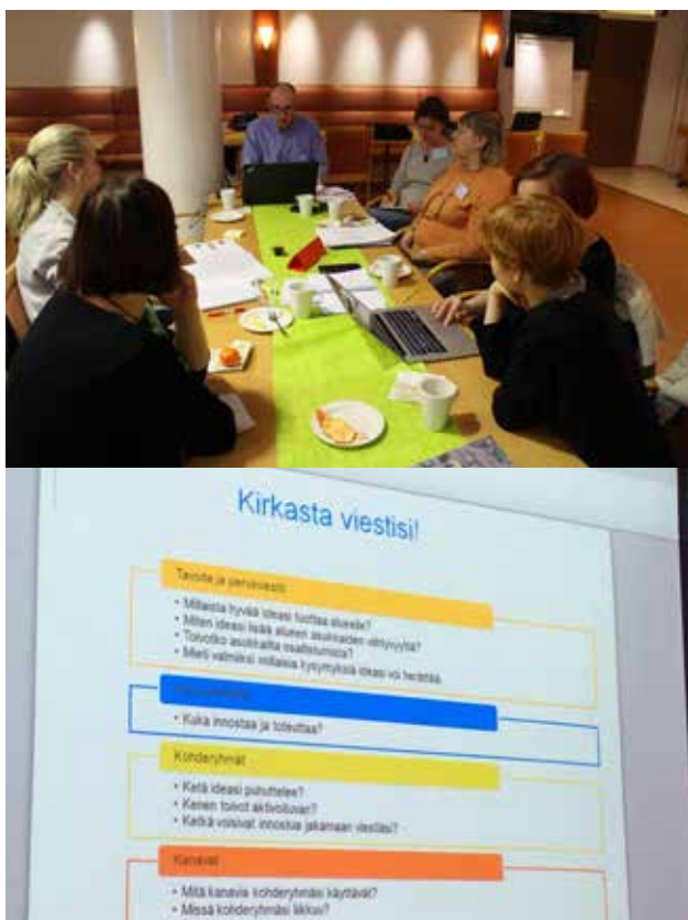
Kuva 2. Työpajatyöskentelyä.

Äänestysvaihetta tuotiin esille monella tavalla. Tutkijat ja virkamiehet jalkautuivat useisiin tapahtumiin kertomaan äänestyksestä. Lisäksi henkilökohtaista ohjausta ja neuvontaa oli tarjolla viitenä etukäteen ilmoitettuna aikana Entressen kirjastossa ja yhteis- palvelupisteessä, joissa oli yleisön käytössä tietokoneita. Myös kirjaston henkilökunta opasti kirjaston