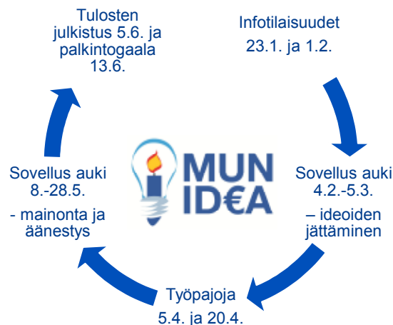
Kuva 1. Mun Idea-kokeilun aikataulu keväällä 2017

Maalikuussa kokeilusta ilmestyi kaksi sanomalehtiartikkeliä Keski-Espoon sanomissa. Samanaikaisesti Espoon virkamiehet tiedottivat osallistuvan budjetoinnin päämäärästä ja tavoitteista osana Osallistuva Espoo – poikkihallinnollista kehitysohjelmaa ja Espoo-tarinaa. Asiasta laadittiin mediatiedote ja Espoon kaupungin verkkosivuilla oli Mun Idean toimintaohjeet sekä pääsy verkkosovelluksen linkkeihin. Henkilökohtaista ohjausta oman ideansa liittämiseksi verkko-sovellukseen oli tarjolla puhelimitse. Muutama asukas käyttikin mahdollisuuden jutella ideastaan henkilökohtaisesti tai he kysyivät neuvoa sovelluksen käyttämiseen.