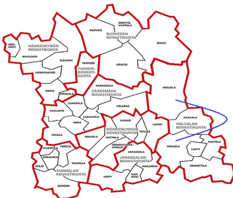
TAULUKKO 1. Hiippakuntakartta. (Hiippakuntakartta 2016.)

Hämeenkyrön rovastikuntaan kuuluu yhteensä kuusi seurakuntaa, joista isoimmat maantieteellisesti ovat Ikaalinen ja Ylöjärvi. Kaupunkiseurakuntia hiippakunnassa on kaksi; Nokia ja Ylöjärvi. Hämeenkyrö, Ikaalinen ja Jämijärvi ovat asu- tukseltaan maalaisseurakunnan tyyppisiä. (Ala-Kuusisto 2017.)