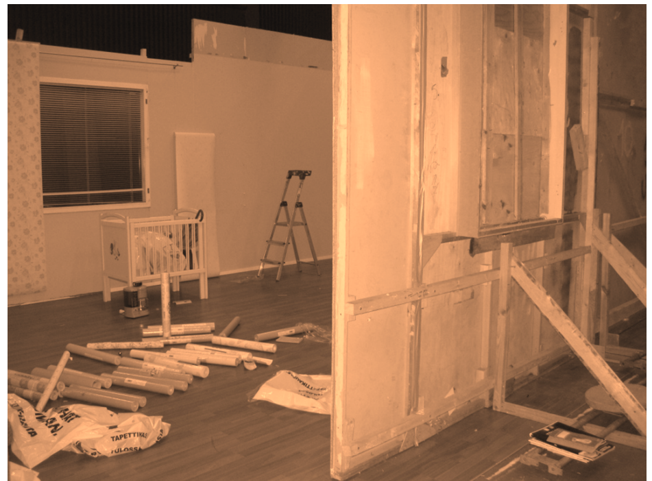
Ideasta käytäntöön on vielä matkaa.