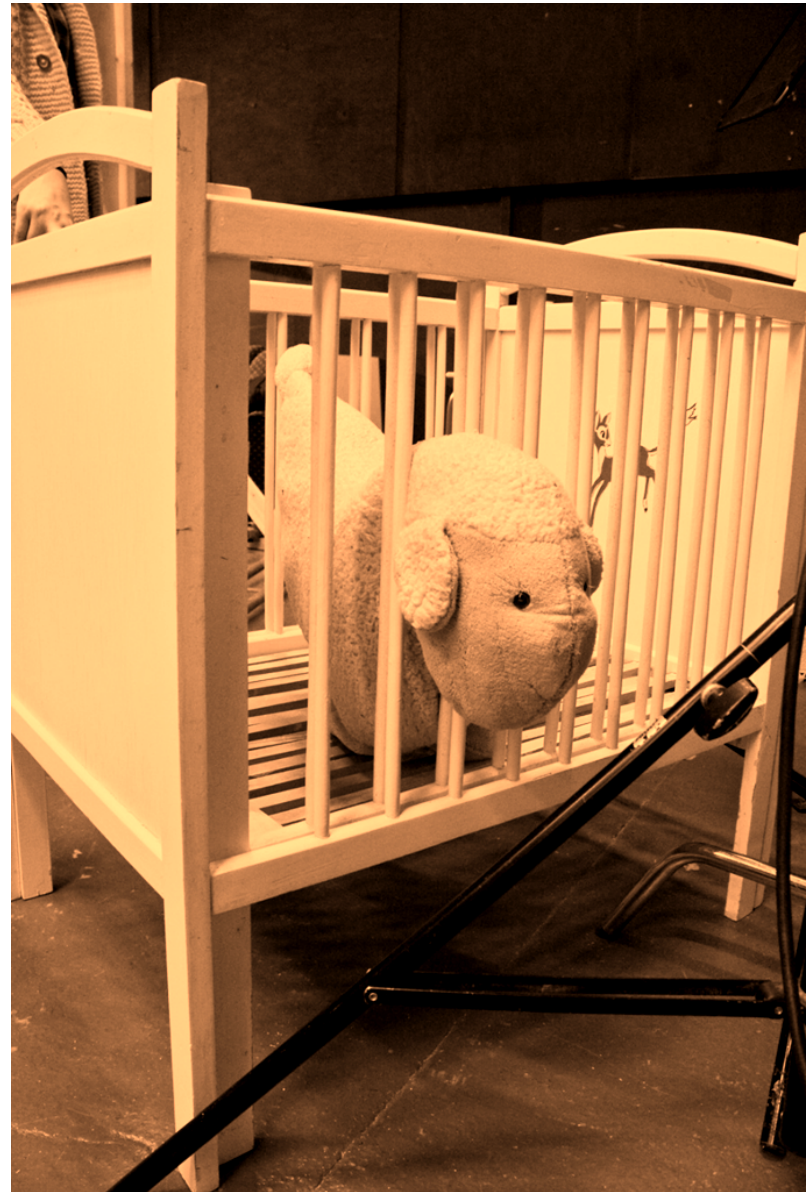
Väsynyt mutta onnellinen?

AKSELI Joo kiitos. Akseli kääntää katseensa pieneen peiliin (rajaus silmiin). FADE OUT.