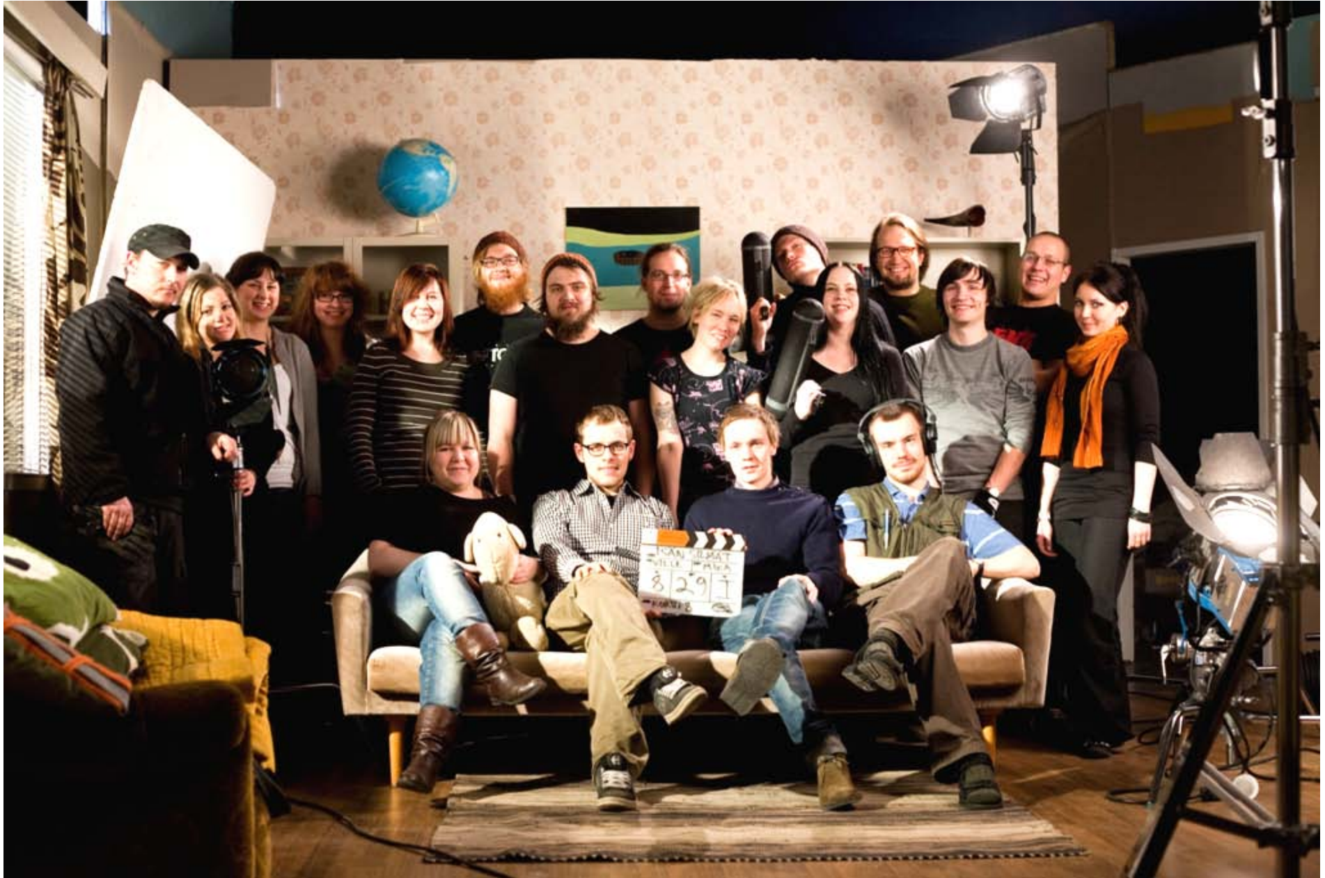
Isän silmien koko kuvausryhmä ja sohvilla opinnäytetyön tekijät.