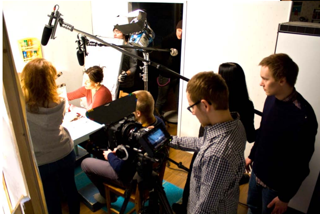
Tiivis tunnelma keittiölavasteissa.