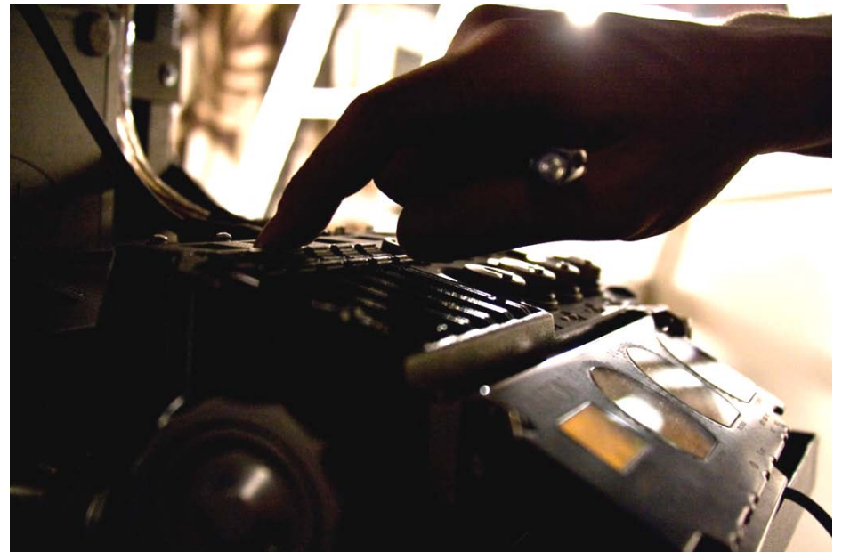
Cantar-X – teenkö sellaisella enää töitä?

Isän silmät oli, kaikista viivästymisistä ja vaikeuksista huolimatta, yksi miellyttävimmistä projekteista missä olen ollut mukana. Ryhmämme yhteensulautuneisuus ja hyvin toimiva yhteistyö ohjaaja Vainion kanssa jättivät työstäni hyvän jälkimaun. Toivon todella, että saan vielä tilaisuuden työskennellä näiden ihmisten kanssa myös tulevaisuudessa.