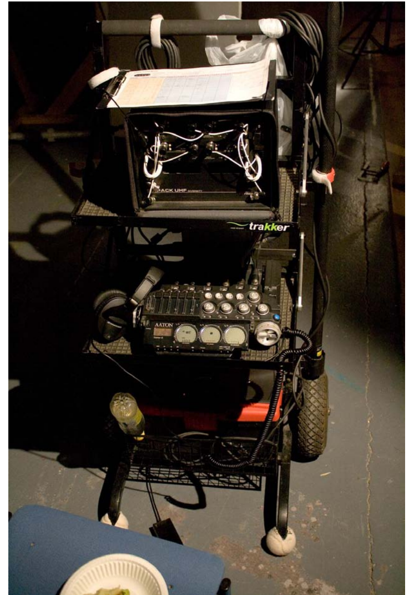
Kallista kalustoa.

Avainsanat: lyhytelokuva, elokuva, äänitys, äänisuunnittelu, jälkituotanto