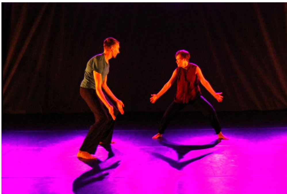
KUVA 5. Jammaus tasoilla